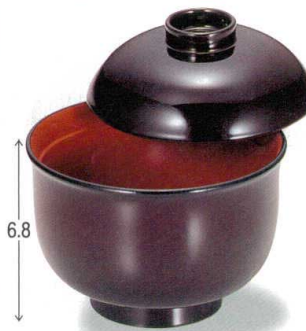
10-192-2 W-1-7 TA 3.3寸リリー碗 溜内朱 ¥1,950 (9.8φ×9) 梱100 230cc