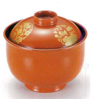
10-192-4 W-4-36 TA 3.3寸リリー碗 四君子 S・H塗 ¥2,700 (9.8φ×9) 梱100 230cc