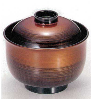
10-192-3 W-1-9 TA 3.3寸リリー碗 茶金かすみ ¥2,500 (9.8φ×9) 梱100 230cc