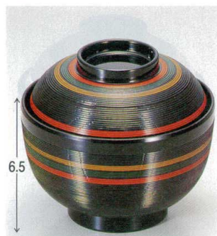
10-192-9 1-163-1 TA 玉子千筋碗 ロクロ目 ¥1,500 (10.2φ×9) 梱100 220cc