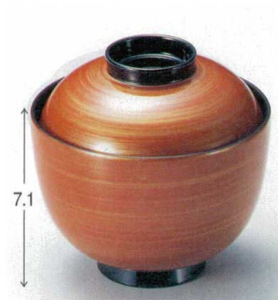
10-192-14 W-5-60 TA 3.1寸丸型吸碗 朱こがね ¥2,500 (9.6φ×9.6) 梱100 240cc