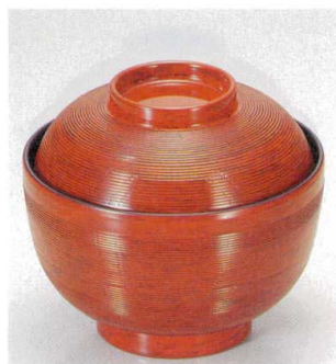
10-192-10 1-163-2 TA 玉子千筋碗 後藤塗 ¥1,550 (10.2φ×9) 梱100 220cc