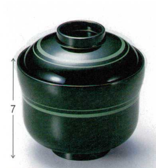
10-192-13 W-5-61 TM 3寸ひさご小吸碗 グリーンライン ¥2,300 (8.9φ×9.2) 梱100 240cc