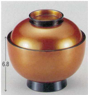
10-192-15 W-5-7 TA 3.5寸丸吸碗 紅金内朱つば黒 S・H塗 ¥2,700 (10.1φ×9.7) 梱100 270cc