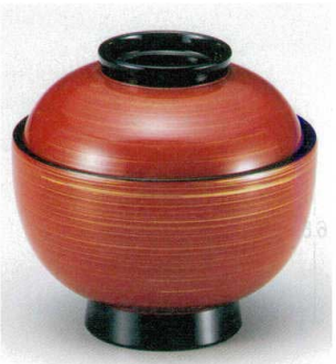
10-192-16 W-10-30 TA 3.5寸丸吸碗 赤こがね S・H塗 ¥3,000 (10.1φ×9.7) 梱100 270cc