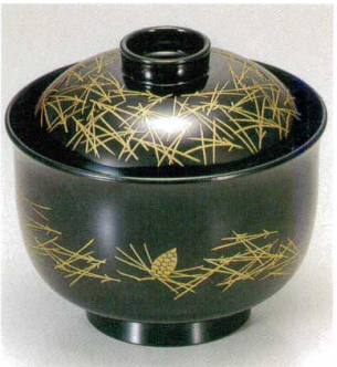
10-192-8 1-154-16 TA 3.3寸リリー碗 黒松ボックリ ¥2,950 (9.8φ×9) 梱100 230cc