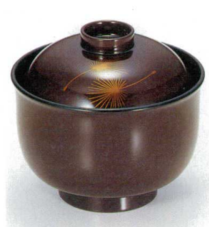
10-192-5 W-1-10 TA 3.3寸リリー碗 白壇松葉 S・H塗 ¥2,700 (9.8φ×9) 梱100 230cc