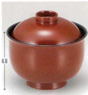
10-192-1 W-12-69 TA 3.3寸リリー碗 銀朱内黒 ¥1,850 (9.8φ×9) 梱100 230cc