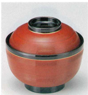
10-192-11 W-11-75 TA 玉子千筋碗 赤刷毛目金線 ¥1,700 (10.2φ×9) 梱100 230cc