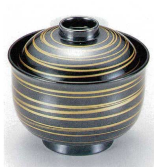
10-192-6 W-4-37 TA 3.3寸リリー碗 銀に金ライン ¥2,800 (9.8φ×9) 梱100 230cc