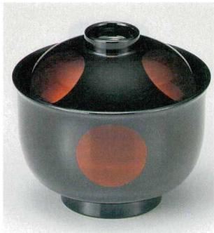
10-192-7 W-11-71 TA 3.3寸リリー碗 白檀日月 S・H塗 ¥2,800 (9.8φ×9) 梱100 230cc