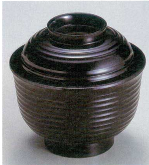
10-197-2 1-158-1 TA 3.3寸美里荒筋吸椀 黒 ¥1,400 (10φ×9.7) 欄100 210cc