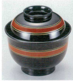
10-197-11 1-176-8 TA 3.3寸美里吸椀 黒駒塗 ¥2,400 (10φ×9.7) 欄100 210cc