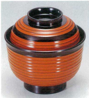
10-197-5 1-158-6 TA 3.3寸美里荒筋吸椀 朱根来ライン ¥1,800 (10φ×9.7) 欄100 210cc