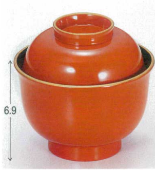
10-197-9 W-1-54 TA 3.3寸美里吸椀 朱天金 ¥1,350 (10φ×9.7) 欄100 210cc