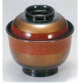
10-197-12 1-158-12 TA 3.3寸美里吸椀 歌舞伎 S・H塗 ¥3,650 (10φ×9.7) 欄100 210cc