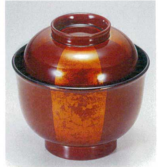
10-197-16 1-158-16 TA 3.3寸美里吸椀 白壇市松 S・H塗 ¥4,350 (10φ×9.7) 欄100 210cc