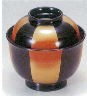
10-197-15 1-158-15 TA 3.3寸美里吸椀 黒朱金市松 S・H塗 ¥3,600 (10φ×9.7) 欄100 210cc