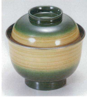
10-197-10 1-187-1 TA 3.3寸美里吸椀 白木かすみ ¥2,000 (10φ×9.7) 欄100 210cc