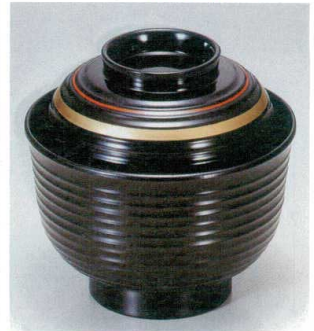
10-197-4 1-158-4 TA 3.3寸美里荒筋吸椀 朱金ライン ¥1,700 (10φ×9.7) 欄100 210cc