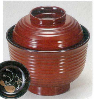
10-197-8 1-158-9 TA 3.3寸美里荒筋吸椀 溜見返しひさご ¥2,800 (10φ×9.7) 欄100 210cc