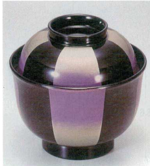
10-197-14 1-158-14 TA 3.3寸美里吸椀 黒紫銀市松 S・H塗 ¥3,600 (10φ×9.7) 欄100 210cc