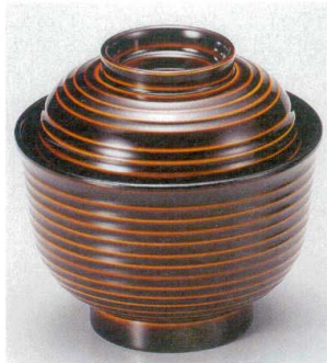
10-197-6 W-12-78 TA 3.3寸美里荒筋椀 漆調朱合春慶 ¥2,300 (10φ×9.7) 欄100 210cc