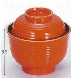
10-197-1 W-1-53 TA 3.3寸美里荒筋吸椀 朱天金 ¥1,350 (10φ×9.7) 欄100 210cc