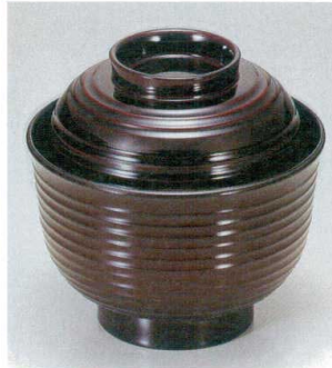
10-197-3 1-158-3 TA 3.3寸美里荒筋吸椀 溜 ¥1,600 (10φ×9.7) 欄100 210cc