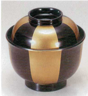
10-197-13 1-158-13 TA 3.3寸美里吸椀 黒金市松 S・H塗 ¥3,500 (10φ×9.7) 欄100 210cc