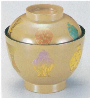
10-203-13 W-3-52 TA 3.5寸玉子椀 宝物 ¥3,000 (10.1φ×10.3) 梱100 250cc