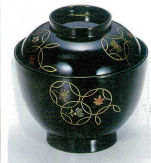
10-203-16 W-1-13 TA 3.5寸玉子椀 華宝 [S・H塗] ¥3,600 (10.1φ×10.3) 梱100 250cc