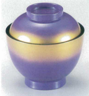
10-203-5 W-4-83 TA 3.5寸玉子椀 紫金ぼかし [S・H塗] ¥2,200 (10.1φ×10.3) 梱100 250cc