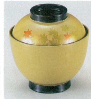
10-203-15 W-3-74 TA 3.5寸玉子椀 かわり紅葉 ¥3,550 (10.1φ×10.3) 梱100 250cc