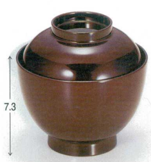
10-203-1 W-1-61 TA 3.5寸玉子椀 溜 ¥1,900 (10.1φ×10.3) 梱100 250cc