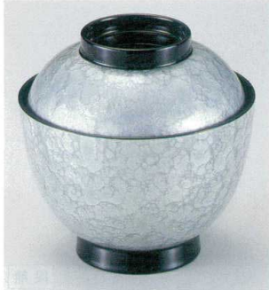
10-203-9 W-4-89 TA 3.5寸玉子椀 銀別甲 [エース塗] ¥2,700 (10.1φ×10.3) 梱100 250cc