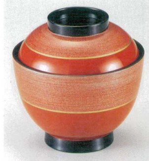
10-203-6 W-4-82 TA 3.5寸玉子椀 朱帯銀かすみ ¥2,500 (10.1φ×10.3) 梱100 250cc