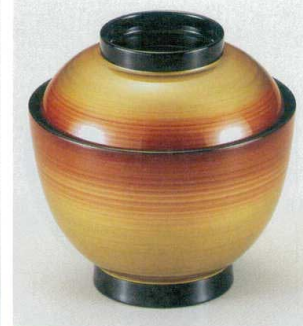
10-203-8 W-4-85 TA 3.5寸玉子椀 金かすみ [S・H塗] ¥2,500 (10.1φ×10.3) 梱100 250cc