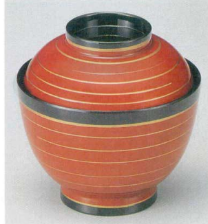
10-203-2 W-11-73 TA 3.5寸玉子椀 朱金ライン ¥1,900 (10.1φ×10.3) 梱100 250cc