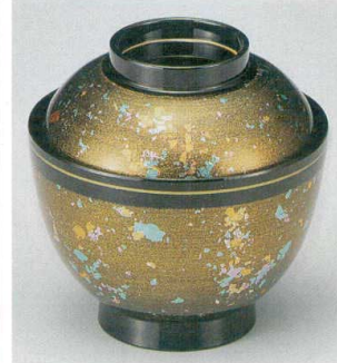
10-203-3 W-12-13A TA 3.5寸玉子椀 金箔ちらし ¥1,900 (10.1φ×10.3) 梱100 250cc