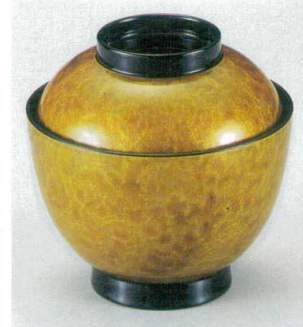
10-203-11 W-4-88 TA 3.5寸玉子椀 黄別甲 [エース塗] ¥2,950 (10.1φ×10.3) 梱100 250cc