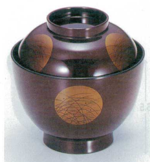
10-203-14 W-1-12 TA 3.5寸玉子椀 白檀日草 [S・H塗] ¥3,300 (10.1φ×10.3) 梱100 250cc