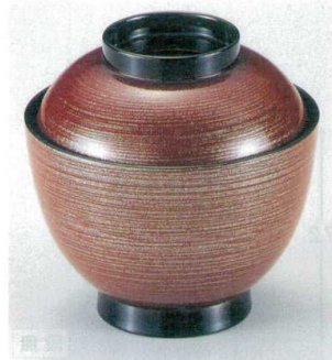
10-203-10 W-3-5 TA 3.5寸玉子椀 赤刷毛目梨地 ¥2,900 (10.1φ×10.3) 梱100 250cc