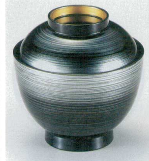
10-203-7 W-4-84 TA 3.5寸玉子椀 銀かすみつば金 [S・H塗] ¥2,550 (10.1φ×10.3) 梱100 250cc