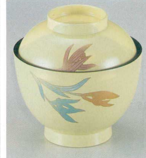
10-203-12 W-3-51 TA 3.5寸玉子椀 蘭 ¥3,000 (10.1φ×10.3) 梱100 250cc