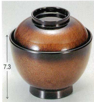
10-204-1 1-163-8 TA 3.5寸玉子椀 アクアブラウン エース塗 ¥2,550 (10.1φ×10.3) 棚100 250cc