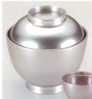
10-204-8 W-2-97 TA 3.5寸玉子椀 紅銀 ¥3,900 (10.1φ×10.3) 棚100 250cc