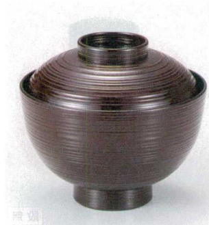
10-204-15 W-16-63 TA 3.8寸小丸刷毛目椀 新溜 ¥1,550 (11.6φ×10) 棚100