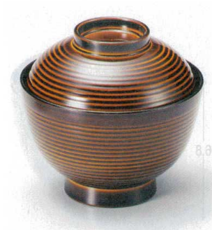
10-204-13 W-12-79 TA 3.6寸高千筋吸椀 漆調朱合春慶 ¥2,200 (10.7φ×9.7) 棚100 280cc