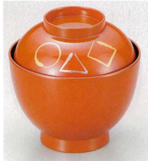
10-204-2 W-8-61 TA 3.5寸玉子椀 朱丸角 ¥2,500 (10.1φ×10.3) 棚100 250cc