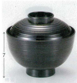
10-204-14 W-16-62 TA 3.8寸小丸刷毛目椀 黒 ¥1,500 (11.6φ×10) 棚100