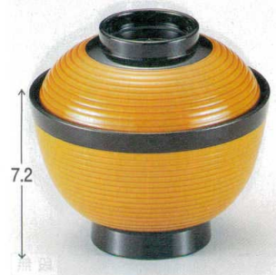
10-204-9 W-5-69 TA 3.6寸高千筋吸椀 春慶帯黒 ¥1,800 (10.7φ×9.7) 棚100 280cc