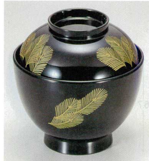
10-204-4 1-163-11 TA 3.5寸玉子椀 黒若松 ¥2,700 (10.1φ×10.3) 棚100 250cc