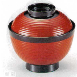
10-204-10 W-5-70 TA 3.6寸高千筋吸椀 紅帯黒 ¥1,750 (10.7φ×9.7) 棚100 280cc