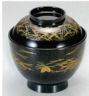
10-204-6 1-163-10 TA 3.5寸玉子椀 黒松ボックリ ¥2,700 (10.1φ×10.3) 棚100 250cc