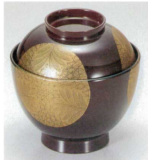
10-204-7 1-163-12 TA 3.5寸玉子椀 溜武蔵野日月 ¥3,400 (10.1φ×10.3) 棚100 250cc