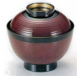
10-204-11 W-5-72 TA 3.6寸高千筋吸椀 小豆つば金 ¥2,100 (10.7φ×9.7) 棚100 280cc