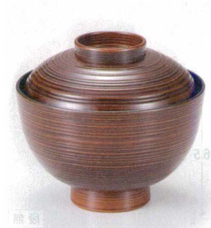
10-204-16 W-16-64 TA 3.8寸小丸刷毛目椀 枳 ¥1,800 (11.6φ×10) 棚100