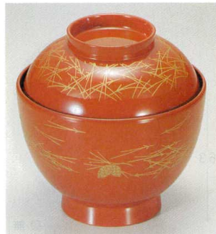
10-204-5 1-163-9 TA 3.5寸玉子椀 朱松ボックリ ¥2,700 (10.1φ×10.3) 棚100 250cc