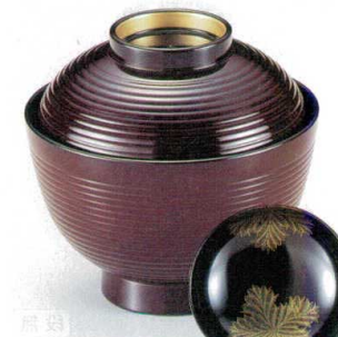
10-204-12 W-5-71 TA 3.6寸高千筋吸椀 溜つば金見返し付 S・H塗 ¥2,750 (10.7φ×9.7) 棚100 280cc