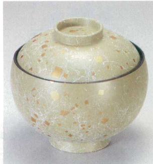
10-205-5 1-162-11 TM 布袋小吸椀 うぐいす和紙塗金箔 ¥3,700 (9.8φ×9) 楕100 240cc