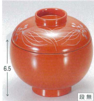
10-205-13 1-162-3 TM てまり吸椀 朱セリ ¥2,550 (9.7φ×9.4) 楕100 270cc