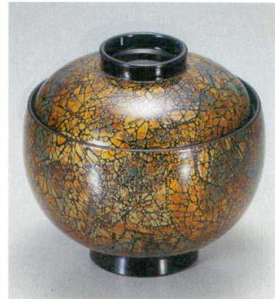
10-205-4 1-162-10 TM 布袋小吸椀 黒虹彩 ¥3,600 (9.8φ×9) 楕100 240cc