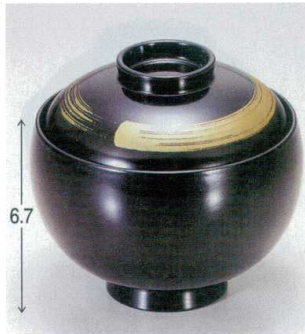
10-205-1 1-162-1 TM 布袋小吸椀 黒一筆 ¥2,150 (9.8φ×9) 楕100 240cc