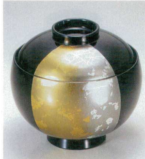
10-205-7 1-162-16 TM 布袋小吸椀 金銀色紙 ¥6,300 (9.8φ×9) 楕100 240cc