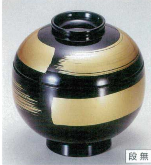
10-205-10 1-162-6 TM 玉姫小吸椀 黒一筆 ¥3,200 (9.2φ×9.5) 楕100 270cc