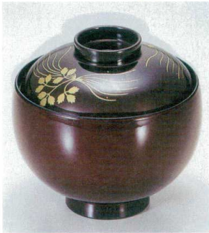
10-205-2 1-162-8 TM 布袋小吸椀 溜セリ S・H塗 ¥2,900 (9.8φ×9) 楕100 240cc