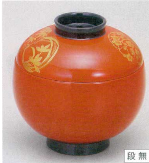
10-205-14 W-11-38 TM てまり吸椀 朱花丸 S・H塗 ¥3,000 (9.7φ×9.4) 楕100 270cc