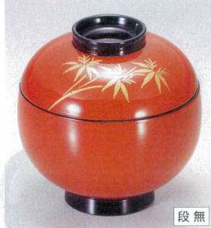
10-205-9 1-162-4 TM 玉姫小吸椀 朱つば黒笹 S・H塗 ¥3,100 (9.2φ×9.5) 楕100 270cc