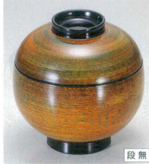
10-205-11 1-162-14 TM 玉姫小吸椀 つむぎ征目 S・H塗 ¥4,300 (9.2φ×9.5) 楕100 270cc