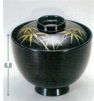
10-205-16 1-162-7 TM 法師椀 黒に笹 S・H塗 ¥2,950 (9.2φ×8.6) 楕100 220cc