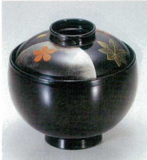
10-205-6 1-162-12 TM 布袋小吸椀 月見春秋 S・H塗 ¥3,800 (9.8φ×9) 楕100 240cc