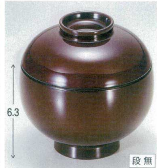
10-205-8 1-162-2 TM 玉姫小吸椀 溜 ¥2,500 (9.2φ×9.5) 楕100 270cc