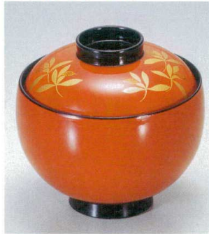
10-205-3 1-162-9 TM 布袋小吸椀 朱ラン S・H塗 ¥3,200 (9.8φ×9) 楕100 240cc