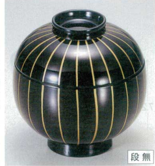
10-205-12 1-162-15 TM 玉姫小吸椀 金十草 S・H塗 ¥4,550 (9.2φ×9.5) 楕100 270cc