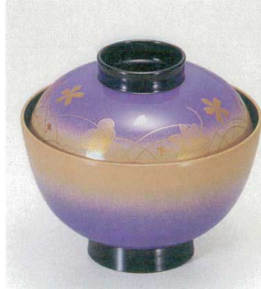
10-207-11 1-166-14 TA 越前椀 露草春秋梅 [S・H塗] ¥3,600 (11.1φ×9.9) 楕100 240cc