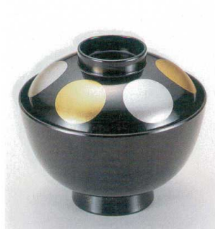
10-207-9 W-4-93 TA 越前椀 黒金雅日月 ¥3,050 (11.1φ×9.9) 楕100 240cc