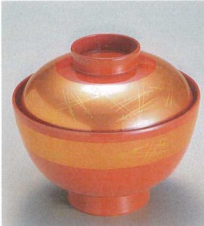
10-207-6 1-166-5 TA 越前椀 朱に帯金松葉内朱 [S・H塗] ¥2,750 (11.1φ×9.9) 楕100 240cc