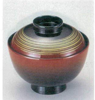
10-207-4 W-4-92 TA 越前椀 朱ぼかし金かすり [S・H塗] ¥2,550 (11.1φ×9.9) 楕100 240cc