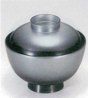
10-207-2 1-166-2 TA 越前椀 黒かすみ ¥2,100 (11.1φ×9.9) 楕100 240cc