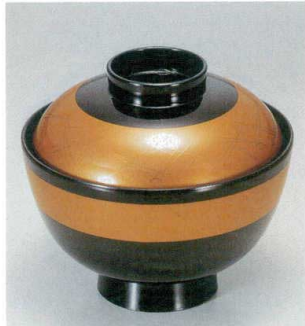
10-207-5 1-166-4 TA 越前椀 黒に帯金松葉 [S・H塗] ¥2,750 (11.1φ×9.9) 楕100 240cc