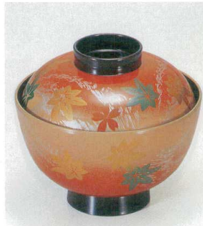
10-207-15 1-166-16 TA 越前椀 竜田川 [S・H塗] ¥4,600 (11.1φ×9.9) 楕100 240cc