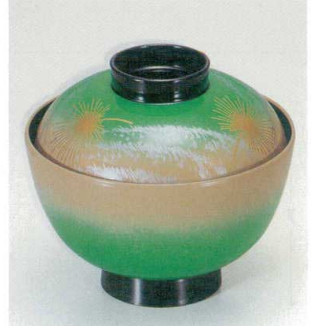
10-207-12 1-166-15 TA 越前椀 水に松 [S・H塗] ¥3,600 (11.1φ×9.9) 楕100 240cc