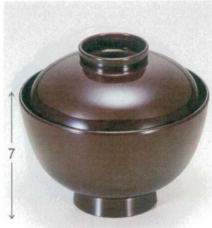
10-207-1 1-166-1 TA 越前椀 溜 ¥1,800 (11.1φ×9.9) 楕100 240cc