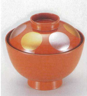
10-207-10 W-4-94 TA 越前椀 朱内朱金雅日月 ¥3,050 (11.1φ×9.9) 楕100 240cc