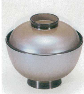
10-207-3 1-166-3 TA 越前椀 ページュかすみ ¥2,400 (11.1φ×9.9) 楕100 240cc