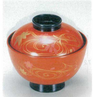
10-207-8 1-166-9 TA 越前椀 朱竜田川 [S・H塗] ¥3,350 (11.1φ×9.9) 楕100 240cc