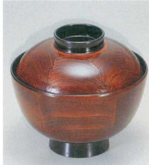
10-207-7 1-166-6 TA 越前椀 溜波刷毛目 [S・H塗] ¥2,900 (11.1φ×9.9) 楕100 240cc