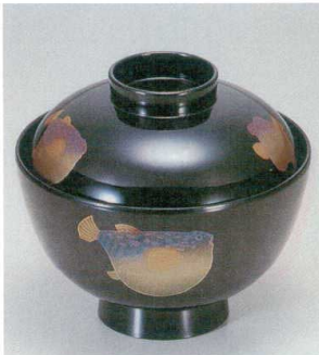
10-207-14 1-166-11 TA 越前椀 黒ふぐ [S・H塗] ¥4,250 (11.1φ×9.9) 楕100 240cc