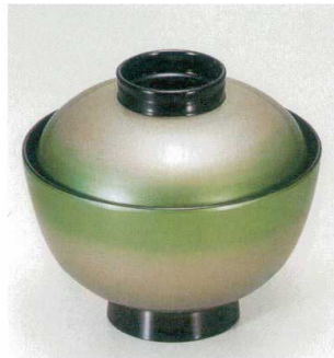
10-207-13 1-166-13 TA 越前椀 緑銀ぼかし [S・H塗] ¥3,950 (11.1φ×9.9) 楕100 240cc