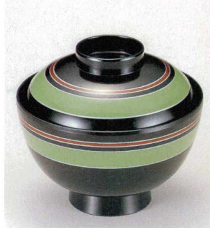
10-208-3 1-167-2 TA 越前椀 二色ライン ¥2,150 (11.1φ×9.9) 楕100 240cc