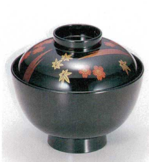
10-208-14 W-1-41 TA 越前椀 雲春秋 S・H塗 ¥3,050 (11.1φ×9.9) 楕100 240cc