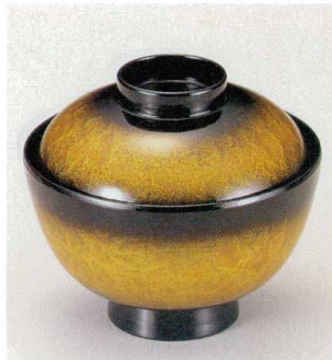
10-208-7 1-167-3 TA 越前椀 アクアイエロー エース塗 ¥2,550 (11.1φ×9.9) 楕100 240cc