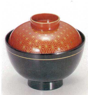
10-208-15 W-1-40 TA 越前椀 麻の葉朱 S・H塗 ¥3,250 (11.1φ×9.9) 楕100 240cc