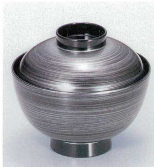
10-208-11 W-2-16 TA 越前椀 銀かすみ S・H塗 ¥2,700 (11.1φ×9.9) 楕100 240cc