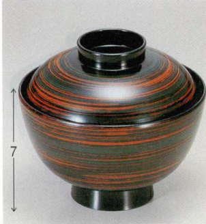
10-208-1 1-167-1 TA 越前椀 二色刷毛目 ¥2,050 (11.1φ×9.9) 楕100 240cc