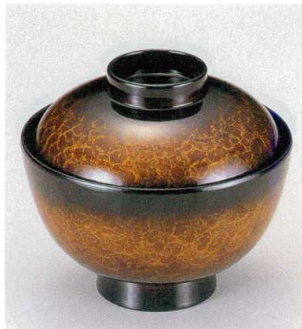
10-208-8 1-167-4 TA 越前椀 アクアブラウン エース塗 ¥2,550 (11.1φ×9.9) 楕100 240cc