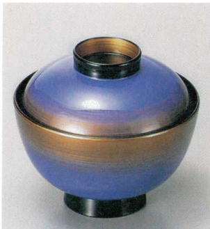
10-208-13 W-12-49 TA 越前椀 紫金ぼかしつば金 S・H塗 ¥2,800 (11.1φ×9.9) 楕100 240cc