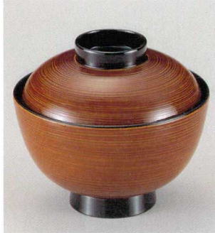
10-208-2 W-4-96 TA 越前椀 春慶刷毛目 ¥2,050 (11.1φ×9.9) 楕100 240cc