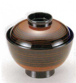
10-208-4 W-2-15 TA 越前椀 溜筋目塗り分け ¥2,150 (11.1φ×9.9) 楕100 240cc