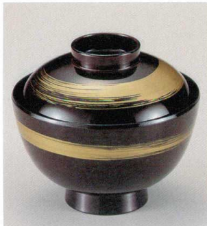
10-208-5 W-4-95 TA 越前椀 溜一筆 ¥2,150 (11.1φ×9.9) 楕100 240cc