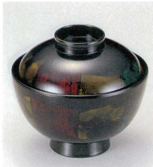
10-208-9 1-167-5 TA 越前椀 かすり ¥2,550 (11.1φ×9.9) 楕100 240cc