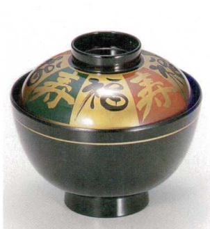
10-208-16 W-1-42 TA 越前椀 福寿 S・H塗 ¥3,800 (11.1φ×9.9) 楕100 240cc