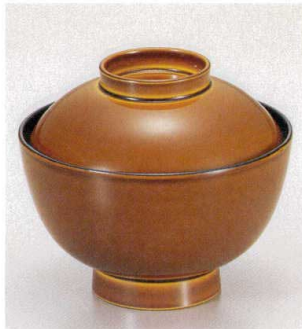
10-208-6 1-8-11 TA 新越前椀 漆調春慶塗 ¥2,550 (11.1φ×9.7) 楕100 240cc