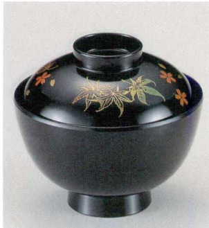
10-208-12 W-4-97 TA 越前椀 黒に春秋 S・H塗 ¥2,750 (11.1φ×9.9) 楕100 240cc