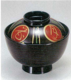
10-209-10 1-167-9 TA新越前椀 風雪月花 エース塗 ¥3,650 (11.1φ×9.7) 楕100 290cc