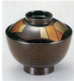
10-209-9 1-166-8 TA新越前椀 溜結び S・H塗 ¥3,450 (11.1φ×9.7) 楕100 290cc