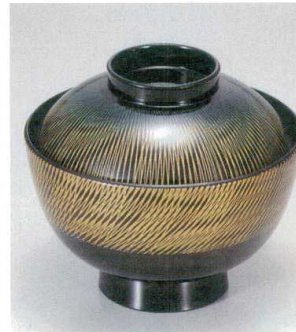
10-209-15 1-167-14 TA新越前椀 萬松 エース塗 ¥3,550 (11.1φ×9.7) 楕100 290cc