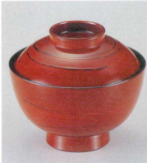
10-209-6 W-5-1 TA新越前椀 渦根来 ¥3,150 (11.1φ×9.7) 楕100 290cc