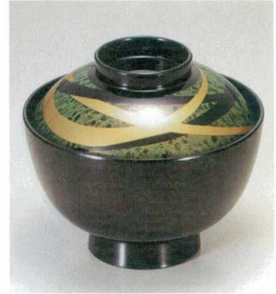
10-209-12 1-167-7 TA新越前椀 金緑幸輪 エース塗 ¥3,500 (11.1φ×9.7) 楕100 290cc