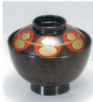
10-209-13 1-167-11 TA新越前椀 六ひょうたん エース塗 ¥3,650 (11.1φ×9.7) 楕100 290cc