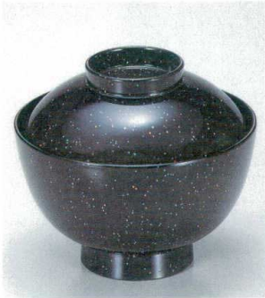
10-209-2 W-2-12 TA新越前椀 青貝 ¥1,750 (11.1φ×9.7) 楕100 290cc