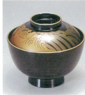
10-209-11 1-168-6 TA新越前椀 黒金波 S・H塗 ¥3,150 (11.1φ×9.7) 楕100 290cc