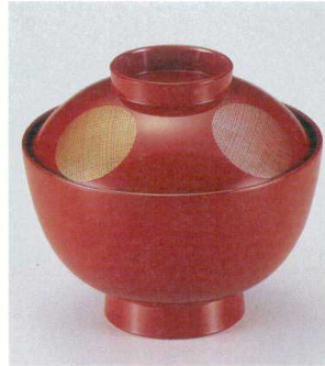
10-209-3 W-4-98 TA新越前椀 朱日月 S・H塗 ¥2,600 (11.1φ×9.7) 楕100 290cc