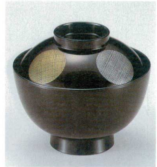
10-209-4 W-4-99 TA新越前椀 黒日月 S・H塗 ¥2,600 (11.1φ×9.7) 楕100 290cc