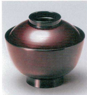
10-209-5 W-9-87 TA新越前椀 溜刷毛目 ¥2,250 (11.1φ×9.7) 楕100 290cc