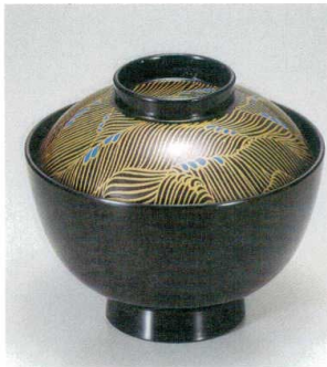
10-209-14 1-167-12 TA新越前椀 金波 エース塗 ¥3,650 (11.1φ×9.7) 楕100 290cc