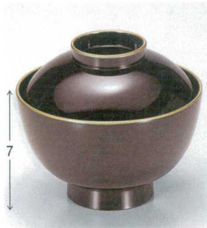
10-209-1 W-2-11 TA新越前椀 マロン天金 ¥1,450 (11.1φ×9.7) 楕100 290cc