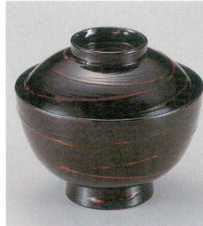
10-209-7 W-5-2 TA新越前椀 渦曙 ¥3,100 (11.1φ×9.7) 楕100 290cc