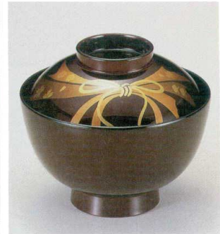
10-209-16 1-166-10 TA新越前椀 溜のし S・H塗 ¥3,750 (11.1φ×9.7) 楕100 290cc