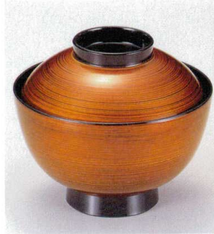
10-210-7 1-168-4 TA 新越前椀 茶金刷毛目 S・H塗 ¥2,950 (11.1φ×9.7) 楕100 290cc