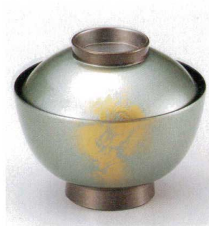
10-210-6 W-10-5 TA 新越前椀 グリーンパール八雲 ¥3,150 (11.1φ×9.7) 楕100 290cc