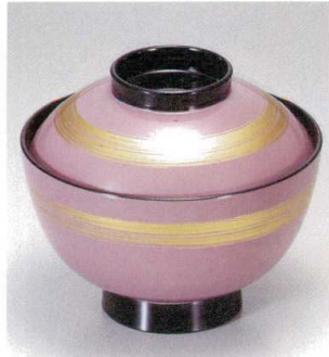
10-210-13 1-168-9 TA 新越前椀 紫金一筆 エース塗 ¥3,850 (11.1φ×9.7) 楕100 290cc