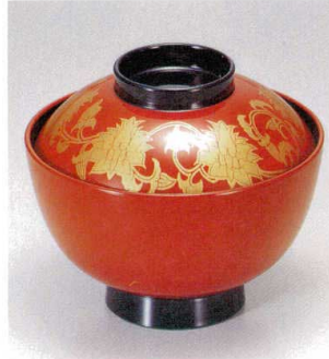
10-210-11 1-168-8 TA 新越前椀 朱唐草 S・H塗 ¥3,600 (11.1φ×9.7) 楕100 290cc