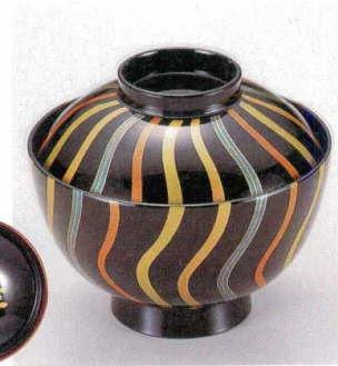
10-210-16 W-5-3 TA 新越前椀 黒十草 ¥4,800 (11.1φ×9.7) 楕100 290cc