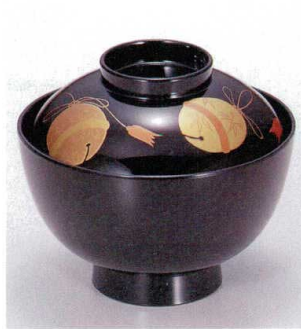
10-210-3 W-1-33 TA 新越前椀 黒鈴 ¥2,700 (11.1φ×9.7) 楕100 290cc