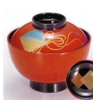
10-210-12 W-1-37 TA 新越前椀 色紙結び見返し色紙 S・H塗 ¥3,650 (11.1φ×9.7) 楕100 290cc