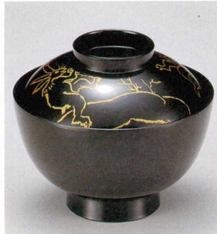
10-210-9 W-11-86 TA 新越前椀 黒平安絵巻 ¥2,300 (11.1φ×9.7) 楕100 290cc