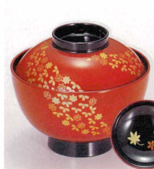
10-210-15 W-1-38 TA 新越前椀 春秋帯春秋見返し付 S・H塗 ¥4,400 (11.1φ×9.7) 楕100 290cc