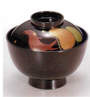
10-210-4 W-1-34 TA 新越前椀 黒老松 ¥2,700 (11.1φ×9.7) 楕100 290cc