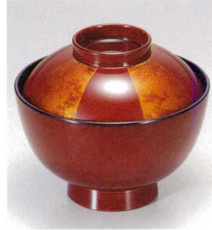
10-210-8 1-168-5 TA 新越前椀 白壇市松 S・H塗 ¥3,100 (11.1φ×9.7) 楕100 290cc