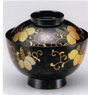
10-210-14 W-10-52 TA 新越前椀 黒に桐唐草 ¥3,300 (11.1φ×9.7) 楕100 290cc