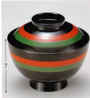
10-210-1 W-11-83 TA 新越前椀 二色ライン ¥1,900 (11.1φ×9.7) 楕100 290cc