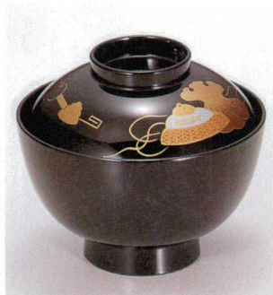
10-210-5 W-1-35 TA 新越前椀 黒七宝 ¥2,800 (11.1φ×9.7) 楕100 290cc