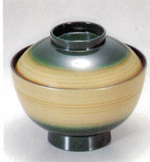
10-210-2 1-187-4 TA 新越前椀 白木かすみ ¥2,150 (11.1φ×9.7) 楕100 290cc