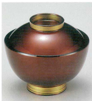
10-211-1 W-11-88 TA 新越前椀 白檀筋目 ¥2,500 (11.1φ×9.7) 椀100 290cc