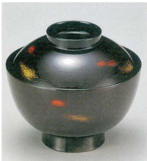
10-211-10 W-11-90 TA 新越前椀 黒 二色曙 ¥2,750 (11.1φ×9.7) 椀100 290cc