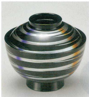
10-211-13 W-11-93 TA 新越前椀 銀麗塗 ¥3,200 (11.1φ×9.7) 椀100 290cc