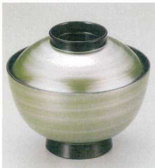
10-211-6 W-8-38 TA 新越前椀 グリーンかすみ ¥2,600 (11.1φ×9.7) 椀100 290cc