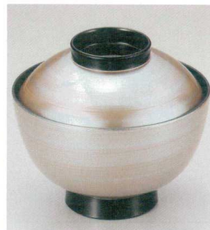
10-211-8 W-8-40 TA 新越前椀 ベージュかすみ ¥2,600 (11.1φ×9.7) 椀100 290cc