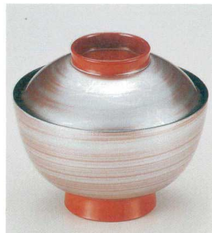
10-211-12 W-11-92 TA 新越前椀 朱かすみつば朱 ¥2,700 (11.1φ×9.7) 椀100 290cc