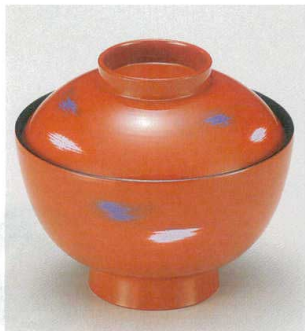
10-211-9 W-11-89 TA 新越前椀 朱 二色曙 ¥2,550 (11.1φ×9.7) 椀100 290cc