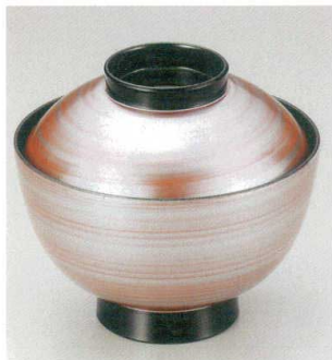
10-211-5 W-8-37 TA 新越前椀 朱かすみ ¥2,600 (11.1φ×9.7) 椀100 290cc