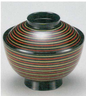
10-211-15 W-11-95 TA 新越前椀 朱金ライン引 ¥3,300 (11.1φ×9.7) 椀100 290cc