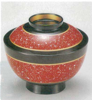
10-211-14 W-11-94 TA 新越前椀 帯朱ラメ入りつば金 ¥3,200 (11.1φ×9.7) 椀100 290cc