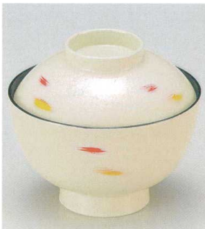
10-211-11 W-11-91 TA 新越前椀 アイボリー二色曙 ¥2,900 (11.1φ×9.7) 椀100 290cc