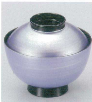
10-211-7 W-8-39 TA 新越前椀 紫かすみ ¥2,600 (11.1φ×9.7) 椀100 290cc