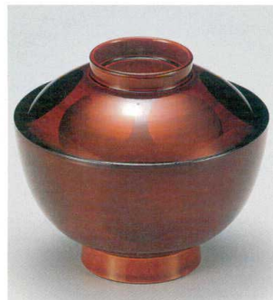
10-211-16 W-11-96 TA 新越前椀 漆調白檀日月 S・H塗 ¥4,650 (11.1φ×9.7) 椀100 290cc