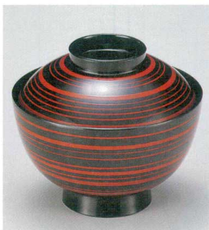
10-211-2 W-11-84 TA 新越前椀 朱ライン ¥2,100 (11.1φ×9.7) 椀100 290cc