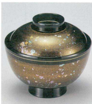
10-211-3 W-12-14A TA 新越前椀 金箔ちらし ¥2,100 (11.1φ×9.7) 椀100 290cc