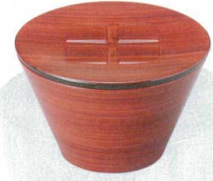
10-215-9 H-76-37 TA kamonA 赤茶刷毛目 ¥970 (11.2φ×0.7) 楕200