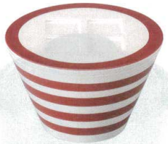
10-215-7 H-76-42 TA kamonB 白朱パール ¥1,000 (11.2φ×0.7) 楕200