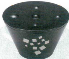
10-215-15 H-76-85 TA ShabonA ブラック ¥660 (11.2φ×0.7) 楕200