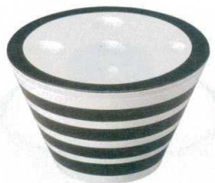
10-215-5 H-76-54 TA shabonB 白黒パール ¥1,000 (11.2φ×0.7) 楕200