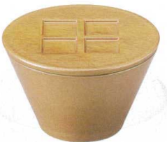
10-215-21 H-76-44 TA kamonB ゴールド雲流 ¥970 (11.2φ×0.7) 楕200