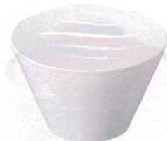
10-215-1 H-76-23 TA seseragi ホワイト ¥800 (11.2φ×0.7) 楕200