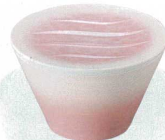
10-215-17 H-76-24 TA seseragi ピンク/白アクア ¥1,220 (11.2φ×0.7) 楕200