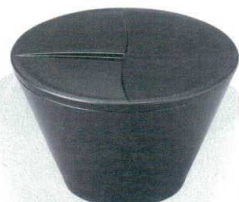
10-215-3 H-76-67 TA fu-sya ブラック ¥700 (11.2φ×0.7) 楕200