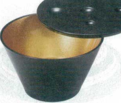
10-215-27 H-76-91 TA shabonB ブラック ¥880 (11.2φ×0.7) 楕200