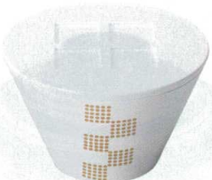
10-215-13 H-76-41 TA kamonB ホワイト ¥800 (11.2φ×0.7) 楕200