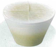
10-215-19 H-76-30 TA fu-sya うぐいす/白アクア ¥1,220 (11.2φ×0.7) 楕200