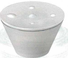
10-215-23 H-76-50 TA shabonA シルバー雲流 ¥970 (11.2φ×0.7) 楕200