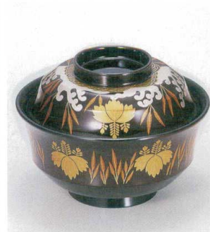
10-223-11 W-1-48 TM 4寸天竜寺椀 溜波芦桐 ¥4,550 (12φ×8.8) 椀100 280cc