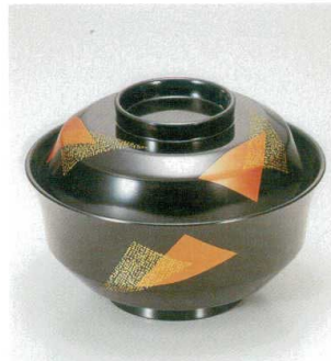
10-223-9 1-187-14-A TM 4寸天竜寺椀 黒モダン ¥4,250 (12φ×8.8) 椀100 280cc