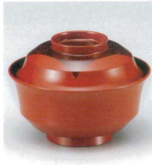
10-223-5 W-10-76 TM 4寸天竜寺椀 朱布張 S・H塗 ¥2,800 (12φ×8.8) 椀100 280cc