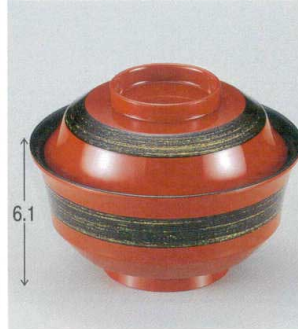
10-223-3 W-5-32 TM 4寸天竜寺椀 赤に金かすり ¥2,650 (12φ×8.8) 椀100 280cc