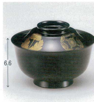
10-223-13 W-10-82 TM 富士羽反椀 黒に菊 S・H塗 ¥3,200 (11.9φ×8.8) 椀100 300cc