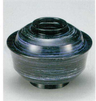
10-223-4 W-12-6 TM 4寸天竜寺椀 紫カスリ ¥2,750 (12φ×8.8) 椀100 280cc