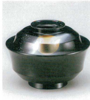
10-223-10 W-10-79 TM 4寸天竜寺椀 金月光 S・H塗 ¥4,500 (12φ×8.8) 椀100 280cc