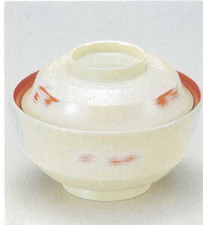
10-223-6 W-12-5 TM 4寸天竜寺椀 アイボリー朱研ぎ出し内朱 ¥2,850 (12φ×8.8) 椀100 280cc