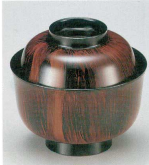
10-223-2 W-12-3 TA 3.7寸羽反吸椀 紫檀 ¥2,500 (11.1φ×10) 椀100 300cc