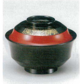
10-223-8 W-10-78 TM 4寸天竜寺椀 市松葉 S・H塗 ¥3,500 (12φ×8.8) 椀100 280cc