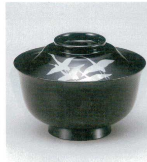
10-223-15 W-10-84 TM 富士羽反椀 黒群れ鶴 S・H塗 ¥3,650 (11.9φ×8.8) 椀100 300cc