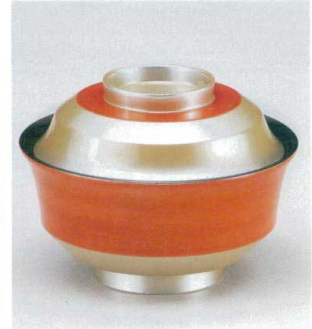
10-223-12 W-10-80 TM 4寸天竜寺椀 赤帯銀地 ¥6,200 (12φ×8.8) 椀100 280cc