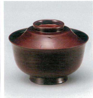
10-223-16 W-10-85 TM 富士羽反椀 古代朱刷毛目 S・H塗 ¥3,950 (11.9φ×8.8) 椀100 300cc