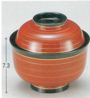
10-223-1 W-12-2 TA 3.7寸羽反吸椀 朱ライン ¥2,000 (11.1φ×10) 椀100 300cc