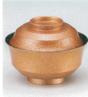
10-223-7 W-10-77 TM 4寸天竜寺椀 錆たたき ¥3,250 (12φ×8.8) 椀100 280cc