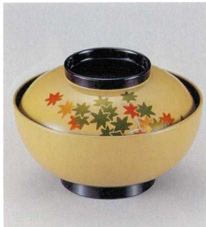
10-226-5 W-3-72 TM 4寸新仙才椀 変わり紅葉 ¥4,350 (12.2φ×8.2) 椀100 290cc