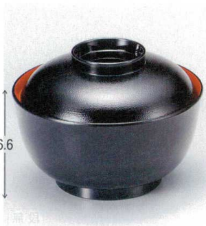
10-226-15 W-13-4 TA 4寸姫椀 黒刷毛目内朱 ¥1,900 (12.6φ×9.4) 椀100 370cc