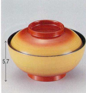
10-226-1 W-5-33 TM 4寸新仙才椀 朱ぼかしライン ¥2,450 (12.2φ×8.2) 椀100 290cc