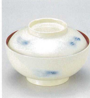
10-226-2 W-12-4 TM 4寸新仙才椀 アイボリー-青研ぎ出し内朱 ¥2,700 (12.2φ×8.2) 椀100 290cc