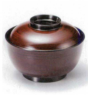
10-226-16 W-13-5 TA 4寸姫椀 茶刷毛目 ¥2,600 (12.6φ×9.4) 100椀 370cc