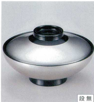
10-226-13 W-12-7 TM 4.5寸平富士椀 銀溜 ¥3,900 (13.5φ×8) 椀100 350cc