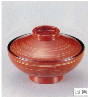
10-226-7 W-5-37 TM 4寸平富士椀 朱金銀かすみ ¥2,900 (12φ×8.1) 椀100 290cc