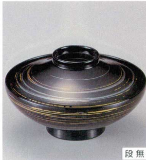
10-226-11 W-5-40 TM 4.5寸平富士椀 黒金銀かすみ ¥3,200 (13.5φ×8) 椀100 350cc