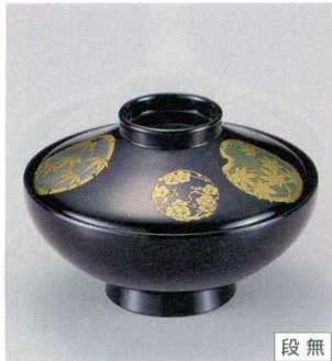
10-226-9 W-5-39 TM 4寸平富士椀 黒花丸 ¥3,350 (12φ×8.1) 椀100 290cc