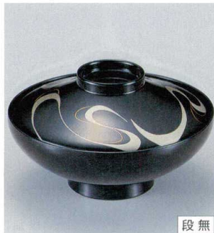
10-226-14 W-5-42 TM 4.5寸平富士椀 黒銀流水 S・H塗 ¥4,100 (13.5φ×8) 椀100 350cc