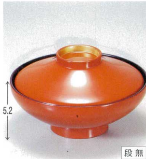
10-226-10 1-203-3 TM 4.5寸平富士椀 朱つば金 ¥2,650 (13.5φ×8) 椀100 350cc