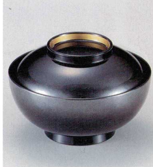
10-226-3 W-5-34 TM 4寸新仙才椀 黒銀ぼかしつば金 ¥2,800 (12.2φ×8.2) 椀100 290cc