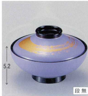
10-226-6 W-5-36 TM 4寸平富士椀 バイオレット金一筆 ¥2,750 (12φ×8.1) 椀100 290cc