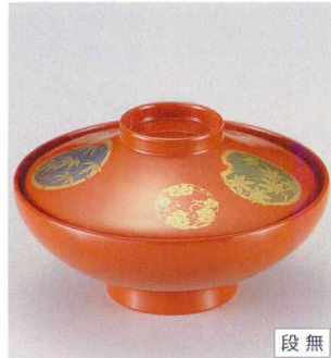
10-226-12 W-5-41 TM 4.5寸平富士椀 総洗朱花丸 ¥3,700 (13.5φ×8) 椀100 350cc