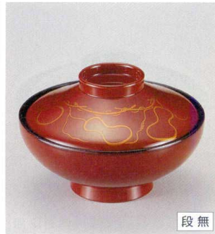
10-226-8 W-5-38 TM 4寸平富士椀 白壇ひさご S・H塗 ¥3,450 (12φ×8.1) 椀100 290cc