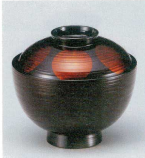
10-229-6 W-10-75 M 3.7寸小丸刷毛目椀 白檀日月 S-H 塗 ¥3,200 (11.1φ×9.9) 梱100 300cc