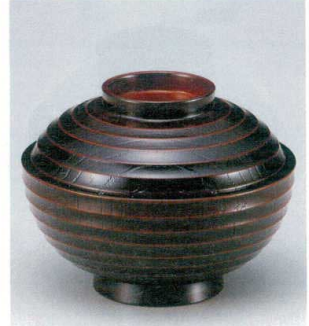
10-229-8 W-10-73 M 4寸段付ケヤキ木目椀 栃 ¥2,050 (12φ×9.1) 梱100 300cc