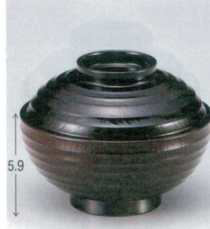
10-229-7 W-10-72 M 4寸段付ケヤキ木目椀 溜 ¥1,850 (12φ×9.1) 梱100 300cc