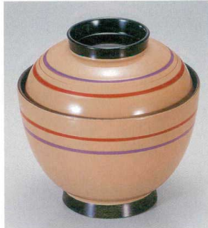
10-229-10 1-163-6 M ナツメ型吸椀 クリーム三色ライン ¥2,200 (10.3φ×10.2) 梱100 250cc