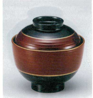
10-229-4 W-10-29 M 3.3寸刷毛目椀 ブラウン塗り分け ¥2,200 (9.9φ×9.7) 梱100 200cc