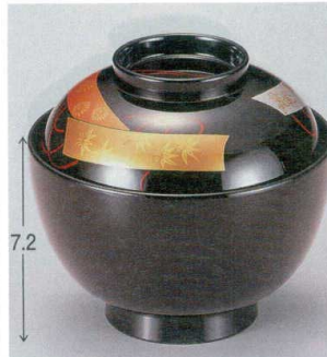
10-229-14 W-4-90 TM 3.7寸玉子椀 黒に短冊 ¥3,100 (11.2φ×10.2) 梱100 310cc