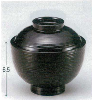
10-229-1 W-10-23 M 3.1寸小丸刷毛目椀 黒 ¥1,800 (9.4φ×9.1) 梱100 190cc