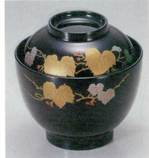
10-229-16 1-163-15 TM 耐熱玉子吸椀 黒ツタ ¥4,500 (10.2φ×9.9) 梱100 240cc