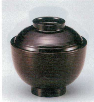
10-229-2 W-10-24 M 3.1寸小丸刷毛目椀 溜 ¥2,000 (9.4φ×9.1) 梱100 190cc