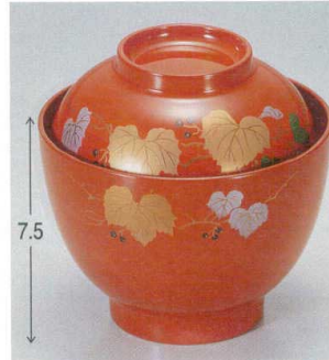
10-229-15 1-163-14 TM 耐熱玉子吸椀 朱ツタ内朱 ¥4,500 (10.2φ×9.9) 梱100 240cc