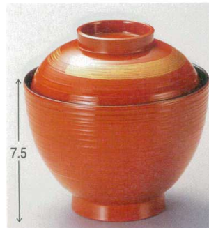
10-229-13 1-163-5 TM あらたま椀 朱一筆 ¥2,500 (10.1φ×10.1) 梱100 250cc