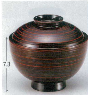
10-229-5 W-10-74 M 3.7寸小丸刷毛目椀 溜筋目 ¥2,400 (11.1φ×9.9) 梱100 300cc