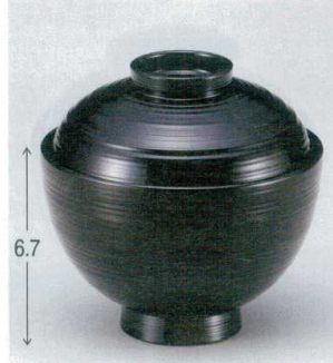
10-229-3 W-10-27 M 3.3寸刷毛目椀 黒 ¥1,700 (9.9φ×9.7) 梱100 200cc