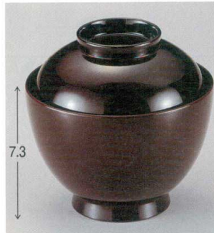
10-229-9 W-4-91 M ナツメ型吸椀 溜 ¥1,900 (10.3φ×10.2) 梱100 250cc