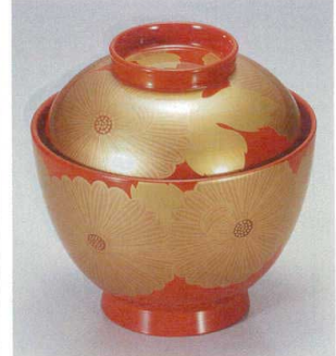
10-229-12 1-163-13 M ナツメ型吸椀 朱大菊内朱 S-H 塗 ¥4,300 (10.3φ×10.2) 梱100 250cc