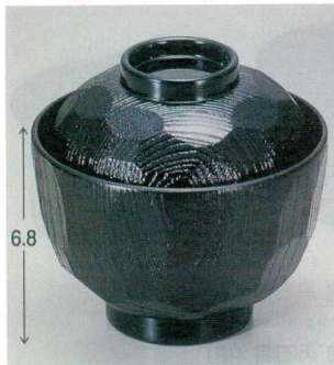
10-231-1 1-178-1 A|3.2寸亀甲小吸椀 黒 ¥550 (9.7φ×9.5) 椀200 180cc