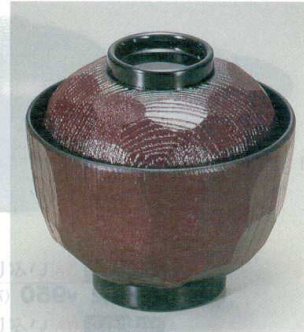
10-231-4 1-178-4 A|3.2寸亀甲小吸椀 溜 ¥600 (9.7φ×9.5) 椀200 180cc