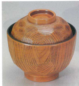
10-231-5 1-178-5 A|3.2寸亀甲小吸椀 柘 ¥900 (9.7φ×9.5) 椀200 180cc