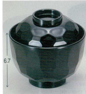
10-231-12 1-178-12 TA真3.2寸亀甲小吸椀 黒 ¥650 (9.7φ×9.2) 椀200 190cc