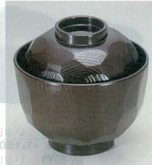
10-231-10 TA耐熱ニュー-3.2寸亀甲小吸椀 溜 1-178-10 ¥850 (9.7φ×9.5) 椀200 180cc 10-231-11 A|ニュー-3.2寸亀甲小吸椀 溜 1-178-11 ¥600 (9.7φ×9.5) 椀200 180cc