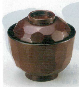
10-231-14 W-9-92 TA真3.2寸亀甲小吸椀 吟朱 ¥700 (9.7φ×9.2) 椀200 190cc