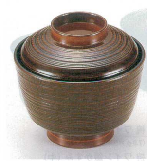
10-231-19 W-5-47 TA天竜寺吸物椀 柘 ¥950 (9.4φ×8.7) 椀200 180cc