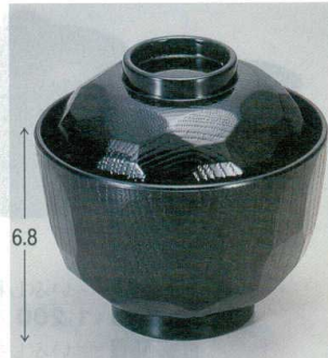
10-231-6 TA耐熱ニュー-3.2寸亀甲小吸椀 黒 1-178-6 ¥650 (9.7φ×9.5) 椀200 180cc 10-231-7 A|ニュー-3.2寸亀甲小吸椀 黒 1-178-7 ¥500 (9.7φ×9.5) 椀200 180cc