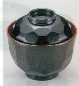
10-231-13 W-2-94 TA真3.2寸亀甲小吸椀 黒内朱 ¥650 (9.7φ×9.2) 椀200 190cc