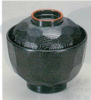
10-231-3 1-178-3 A|3.2寸亀甲小吸椀 黒天朱 ¥550 (9.7φ×9.5) 椀200 180cc