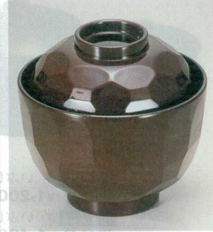
10-231-15 TA真3.2寸亀甲小吸椀 溜 1-178-13 ¥800 (9.7φ×9.2) 椀200 190cc 10-231-16 TA真3.2寸亀甲小吸椀 溜内朱 W-2-95 ¥800 (9.7φ×9.2) 椀200 190cc