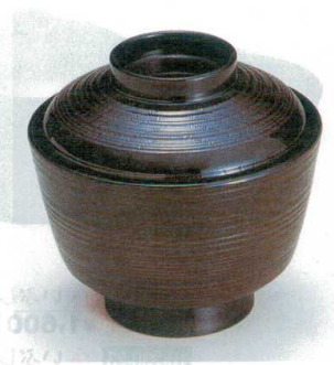
10-231-18 W-3-45 TA天竜寺吸物椀 溜 ¥850 (9.4φ×8.7) 椀200 180cc