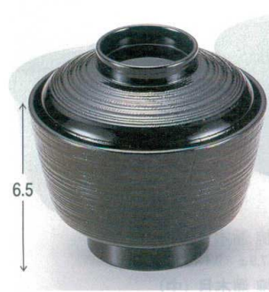
10-231-17 W-5-46 TA天竜寺吸物椀 黒 ¥800 (9.4φ×8.7) 椀200 180cc