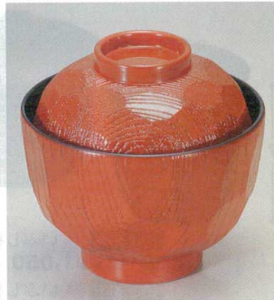
10-231-2 1-178-2 A|3.2寸亀甲小吸椀 朱 ¥550 (9.7φ×9.5) 椀200 180cc