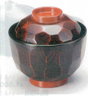
10-231-20 W-12-82 TAニュー-3.2寸亀甲小吸椀 溜研ぎ出し ¥1,300 (9.7φ×9.5) 椀100 180cc