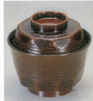
10-235-11 1-180-9 A田吾作吸椀 栃 ¥1,250 (10.2φ×9.4) 欄100 220cc