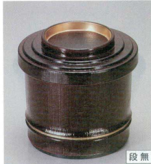
10-235-2 1-180-2 A竹型小吸椀 溜つば金 ¥1,150 (9.2φ×8.8) 欄100 260cc