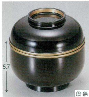
10-235-5 1-180-10 M鈴型小吸椀 黒帯金 ¥1,850 (9φ×9) 欄100 230cc