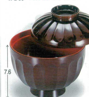
10-235-17 W-2-14 TM3.6寸菊形吸椀 溜内朱 ¥1,900 (10.6φ×10.4) 欄100 410cc