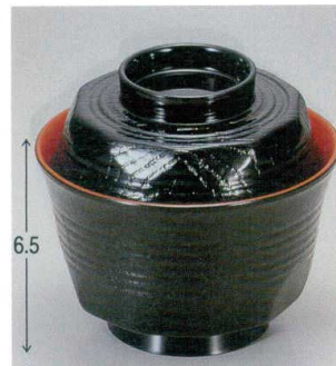
10-235-9 1-180-7 A田吾作吸椀 黒内朱 ¥1,150 (10.2φ×9.4) 欄100 220cc