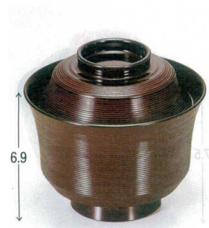
10-235-14 1-154-9 TA3.2寸竹型千筋椀 溜 ¥1,750 (9.8φ×9) 欄100 200cc