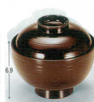
10-235-16 W-2-17 TM3.6寸乱引椀 溜 ¥1,800 (10.8φ×9.8) 欄100 260cc