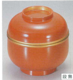
10-235-6 1-180-11 M鈴型小吸椀 朱帯金 ¥1,850 (9φ×9) 欄100 230cc