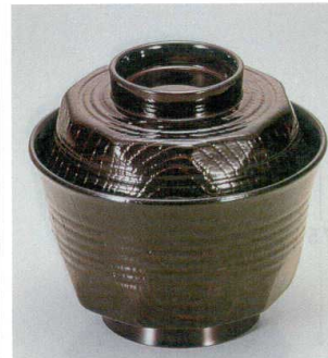
10-235-10 1-180-8 A田吾作吸椀 溜 ¥1,200 (10.2φ×9.4) 欄100 220cc