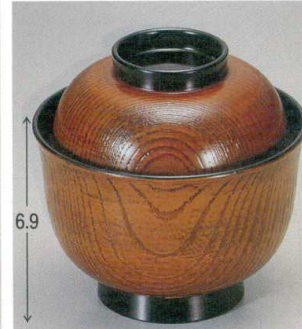
10-235-12 A姫小吸椀 栃 1-180-14 ¥1,450 (10φ×10) 欄100 210cc 10-235-13 TA姫小吸椀 栃 W-2-96 ¥1,700 (10φ×10) 欄100 210cc