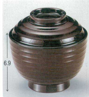
10-235-3 W-5-52 Mロクロ木目小吸椀 溜 ¥1,450 (9.7φ×9.5) 欄100 240cc