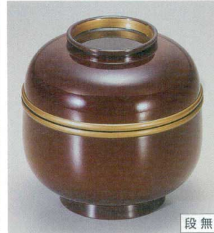
10-235-7 1-180-12 M鈴型小吸椀 溜帯金 ¥1,950 (9φ×9) 欄100 230cc