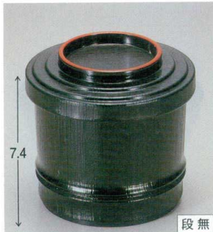
10-235-1 1-180-1 A竹型小吸椀 グリーン天朱 ¥950 (9.2φ×8.8) 欄100 260cc