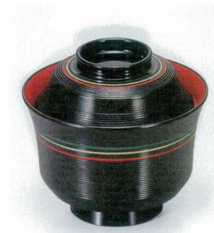
10-235-15 1-154-10 TA3.2寸竹型千筋椀 黒内朱三色ライン ¥1,850 (9.8φ×9) 欄100 200cc