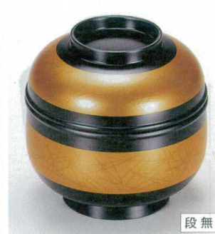
10-235-8 1-180-13 M鈴型小吸椀 黒帯金松葉 ¥2,600 (9φ×9) 欄100 230cc