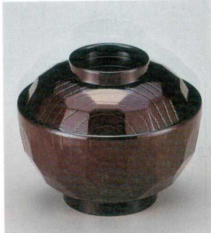
10-237-2 W-12-35 TA ABS3.8寸亀甲吸椀 新溜 ¥1,200 (11.3φ×9.3) 椀100 290cc