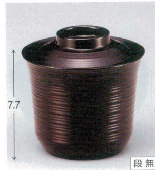
10-237-9 W-10-70 M 3.1寸線引小吸椀 溜 ¥1,600 (9.4φ×9.4) 椀100 300cc