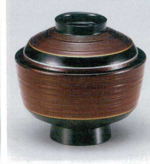
10-237-8 W-10-87 M 3.6寸千筋ケヤキ天竜寺吸椀 溜春慶金銀ライン ¥2,400 (11φ×10.4) 椀100 280cc