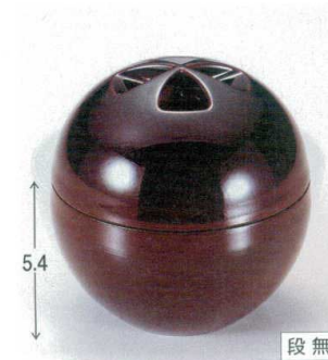
10-237-13 W-4-67 A 源氏椀 溜 ¥1,950 (9.8φ×10.1) 椀100 260cc