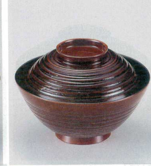
10-237-12 W-5-44 TM 4寸蛤椀 栃 ¥2,050 (12.2φ×8.3) 椀100 280cc