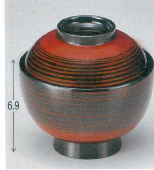
10-237-4 W-11-72 M 3.3寸丸型吸物椀 溜筋目塗り分け ¥1,950 (10.1φ×9.9) 椀100 240cc