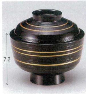
10-237-5 W-9-66 M 3.6寸千筋ケヤキ天竜寺吸椀 黒金ライン ¥1,800 (11φ×10.4) 椀100 280cc