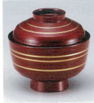
10-237-6 W-10-86 M 3.6寸千筋ケヤキ天竜寺吸椀 ウルミ金ライン ¥2,050 (11φ×10.4) 椀100 280cc