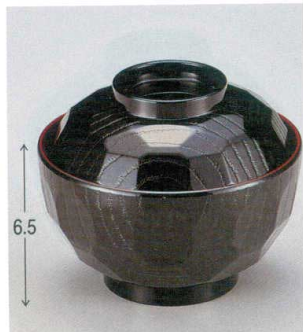
10-237-1 W-12-34 TA ABS3.8寸亀甲吸椀 黒内朱 ¥1,150 (11.3φ×9.3) 椀100 290cc