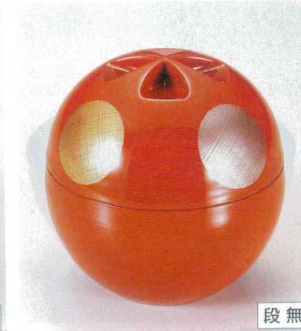
10-237-14 W-4-68 A 源氏椀 朱日月 S・H塗 ¥2,500 (9.8φ×10.1) 椀100 260cc