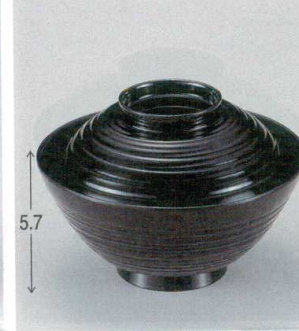
10-237-11 W-5-43 TM 4寸蛤椀 黒 ¥1,850 (12.2φ×8.3) 椀100 280cc