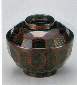
10-237-3 W-12-36 TA ABS3.8寸亀甲吸椀 栃 ¥1,700 (11.3φ×9.3) 椀100 290cc