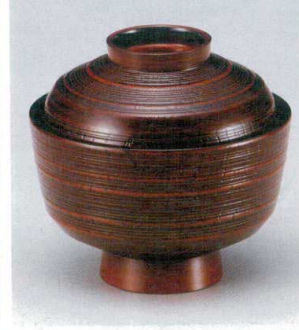
10-237-7 W-9-65 M 3.6寸千筋ケヤキ天竜寺吸椀 栃 ¥2,100 (11φ×10.4) 椀100 280cc