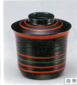
10-237-10 W-10-71 M 3.1寸線引小吸椀 黒朱緑線引 ¥1,950 (9.4φ×9.4) 椀100 300cc