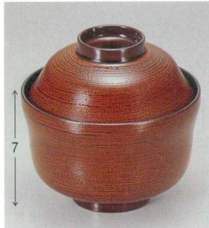
10-243-1 1-186-13 A (小) ひさご吸椀 溜刷毛目 ¥1,400 (10.5φ×10.2) 楕100 300cc