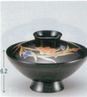
10-243-11 W-10-44 A 丸駒型吸椀 黒に鉄仙 ¥3,600 (13φ×8.5) 楕100