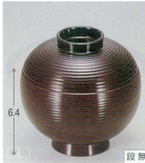
10-243-12 1-183-5 M ちょうちん吸椀 溜 ¥1,700 (9.4φ×9.6) 楕100 250cc