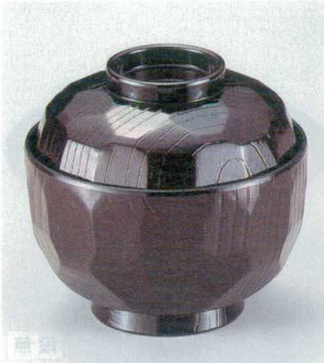
10-243-6 W-5-81 TA 3.6寸亀甲吸椀 新溜 ¥1,950 (11φ×10.2) 楕100 320cc