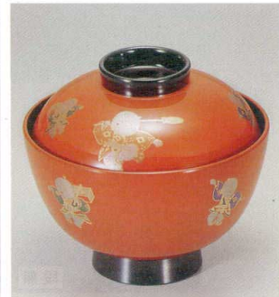
10-243-17 1-186-12 M 越前椀 朱に唐子 ¥3,300 (11φ×9.8) 楕100 270cc