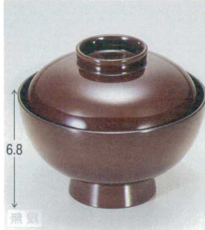
10-243-7 1-186-8 M 直仙才丸吸椀 溜 ¥2,000 (12.1φ×10.1) 楕100 280cc