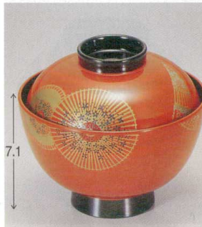
10-243-16 1-186-11 M 越前椀 朱に蛇の目 ¥3,300 (11φ×9.8) 楕100 270cc