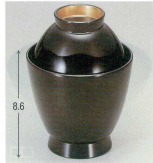
10-243-13 1-182-16 TM 富士型吸椀 溜つば金 ¥2,300 (9.2φ×12.2) 楕100 230cc