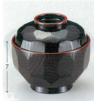
10-243-5 W-5-80 TA 3.6寸亀甲吸椀 黒天朱 ¥1,700 (11φ×10.2) 楕100 320cc