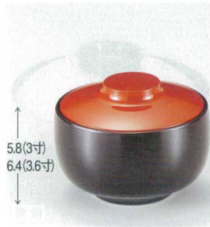
10-243-9 TM 3寸春日椀 赤/黒内黒塗 W-5-83 ¥1,800 (8.8φ×7.5) 楕100 220cc 10-243-10 TM 3.6寸春日椀 赤/黒内黒塗 W-5-84 ¥2,000 (10.5φ×8.2) 楕100 330cc