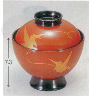
10-243-4 1-183-8 M 小丸吸椀 鶴 ¥1,950 (10.5φ×10) 楕100 230cc