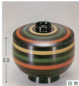
10-243-14 1-183-11 M 百万石小吸椀 黒ライン ¥2,400 (9.3φ×8.7) 楕100 300cc