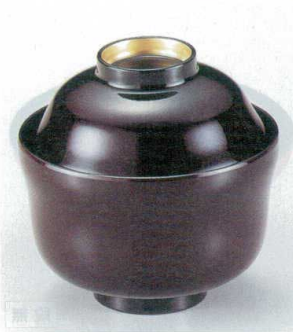
10-243-2 W-5-79 A (小) ひさご吸椀 溜つば金 ¥1,650 (10.5φ×10.2) 楕100 300cc