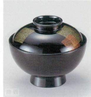
10-243-8 W-5-45 M 直仙才丸吸椀 黒色紙 S・H塗 ¥2,550 (12.1φ×10.1) 楕100 280cc