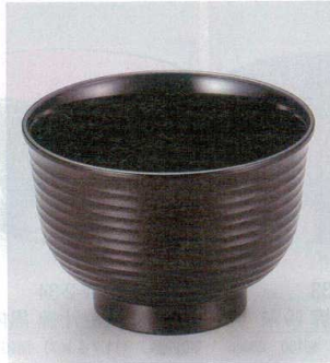
10-249-2 W-8-68 TA 3.3寸美里荒筋汁椀 茶石目 ¥780 (10φ×6.9) 椀200 380cc