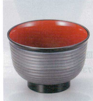
10-249-7 W-8-73 TA 3.3寸美里荒筋汁椀 シルバー内朱 ¥980 (10φ×6.9) 椀200 380cc