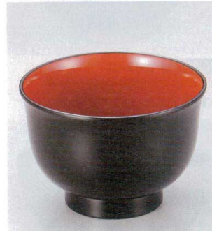
10-249-9 W-8-75 TA 3.3寸美里汁椀 黒内朱 ¥600 (10φ×6.9) 椀200 380cc