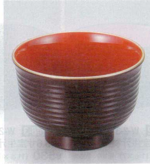
10-249-3 W-8-69 TA 3.3寸美里荒筋汁椀 マロン天金内朱 ¥780 (10φ×6.9) 椀200 380cc