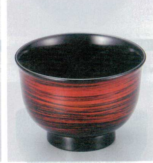
10-249-12 W-8-78 TA 3.3寸美里汁椀 朱流線 ¥780 (10φ×6.9) 椀200 380cc