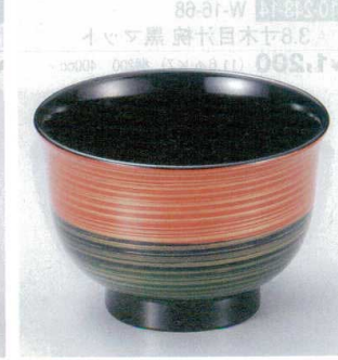
10-249-16 W-8-82 TA 3.3寸美里汁椀 朱緑金ライン ¥1,330 (10φ×6.9) 椀200 380cc