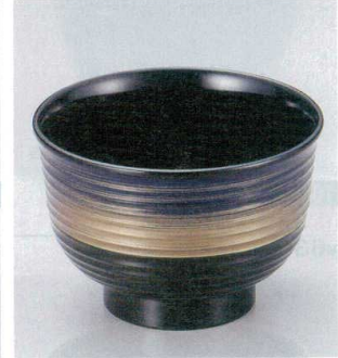
10-249-8 W-8-74 TA 3.3寸美里荒筋汁椀 紫金かすみ ¥1,080 (10φ×6.9) 椀200 380cc