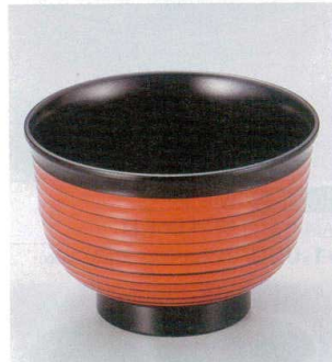
10-249-5 W-8-71 TA 3.3寸美里荒筋汁椀 朱根来ライン ¥800 (10φ×6.9) 椀200 380cc