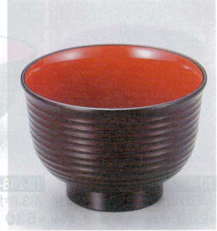
10-249-4 W-8-70 TA 3.3寸美里荒筋汁椀 溜内朱 ¥700 (10φ×6.9) 椀200 380cc