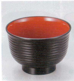
10-249-1 W-8-67 TA 3.3寸美里荒筋汁椀 黒内朱 ¥600 (10φ×6.9) 椀200 380cc