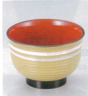
10-249-6 W-8-72 TA 3.3寸美里荒筋汁椀 クリーム二色ライン内朱 ¥930 (10φ×6.9) 椀200 380cc