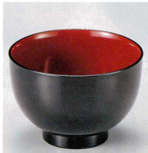
10-250-6 W-12-23 PET なでしこ汁椀 黒内朱 ¥680 (9.8φ×6.8) 椀200 260cc