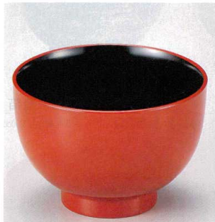
10-250-5 W-12-22 PET なでしこ汁椀 朱内黒 ¥680 (9.8φ×6.8) 椀200 260cc