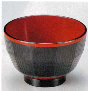
10-250-7 W-12-25 PET 3.6寸ハツリ亀甲木目汁椀 黒内朱測朱 ¥820 (11φ×7.2) 椀200 410cc