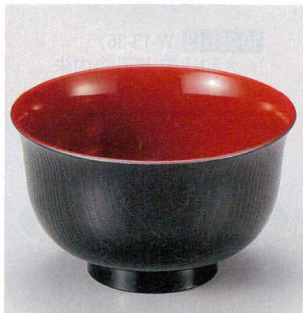
10-250-10 W-12-31 PET 羽反木目汁椀 黒内朱 ¥910 (11.6φ×6.9) 椀200 400cc