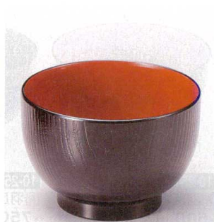
10-250-4 W-13-39 PET 姫木目汁椀 新溜内朱 ¥900 (10.5φ×7.1) 椀100 360cc