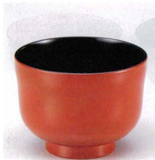
10-250-1 W-10-54 PET ひさご汁椀 朱内黒 ¥730 (10φ×7.5) 椀200 350cc