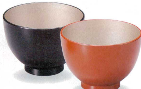
10-250-15 A 九頭竜汁椀 黒内銀溜 W-13-40 ¥1,200 (11.8φ×8.6) 椀100 500cc 10-250-16 A 九頭竜汁椀 朱内銀溜 W-13-41 ¥1,200 (11.8φ×8.6) 椀100 500cc