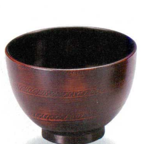
10-250-17 W-13-42A A 九頭竜汁椀 溜根来内黒 ¥1,700 (11.8φ×8.6) 椀100 500cc