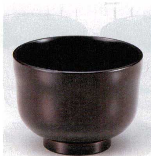
10-250-2 W-10-55 PET ひさご汁椀 溜 ¥900 (10φ×7.5) 椀200 350cc