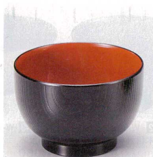
10-250-3 W-13-38 PET 姫木目汁椀 黒内朱 ¥800 (10.5φ×7.1) 椀100 360cc