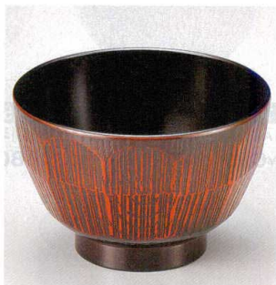
10-250-8 W-12-27 PET 3.6寸ハツリ亀甲木目汁椀 枳ハケ目 ¥1,050 (11φ×7.2) 椀200 410cc