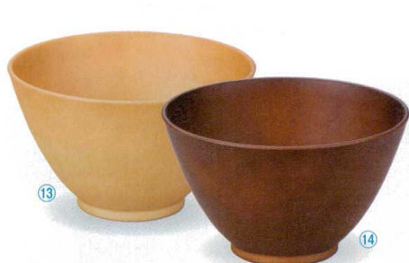
10-250-13 PET 4寸弥生汁椀 総ナチュラル W-17-71 ¥1,000 (12.2φ×7.4) 椀100 440cc 10-250-14 PET 4寸弥生汁椀 総ブラウン W-17-72 ¥1,000 (12.2φ×7.4) 椀100 440cc