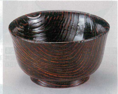
10-253-7 W-3-96 限定品 柾木製木目井 漆曙 ¥2,300 (14.9φ×8.1) 椀72 550cc