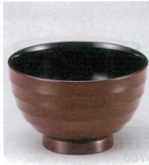
10-253-2 W-10-63 TA ロク口汁椀 銀朱 ¥900 (11.4φ×7.1) 椀200 400cc