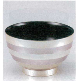
10-253-4 W-10-65 TA ロク口汁椀 銀透き塗り分け ¥1,350 (11.4φ×7.1) 椀200 400cc