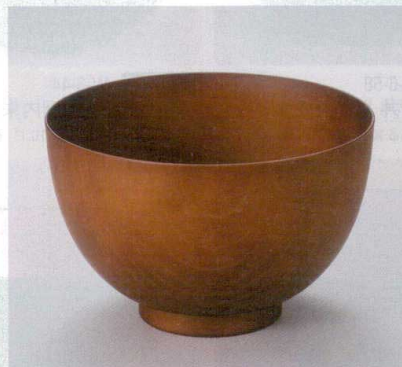
10-253-13 W-17-76 PET 5寸京木目井 総ブラウン ¥1,300 (14.7φ×9.5) 椀100 950cc