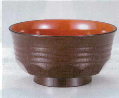
10-253-6 W-14-90 A 5寸田吾作井椀 新溜内朱 ¥1,550 (15φ×7.7) 椀80