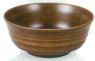
10-253-11 W-17-29 A 6寸千段木目井 総栃刷毛目 ¥2,500 (18.3φ×7.8) 椀80 1,080cc