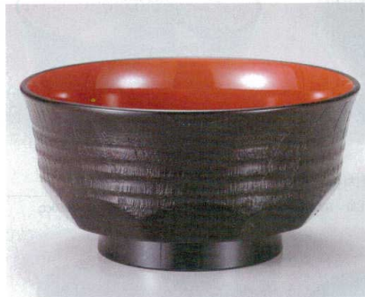
10-253-5 W-14-89 A 5寸田吾作井椀 黒内朱 ¥1,450 (15φ×7.7) 椀80