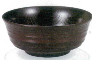
10-253-9 W-17-27 A 6寸千段木目井 溜内黒 ¥1,600 (18.3φ×7.8) 椀80 1,080cc