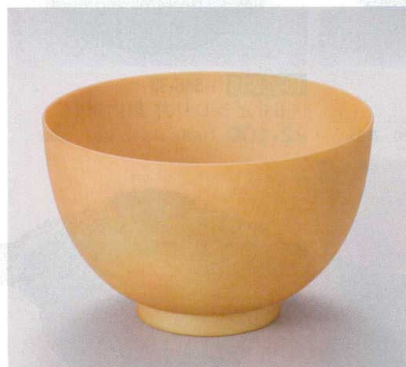
10-253-12 W-17-75 PET 5寸京木目井 総ナチュラル ¥1,300 (14.7φ×9.5) 椀100 950cc