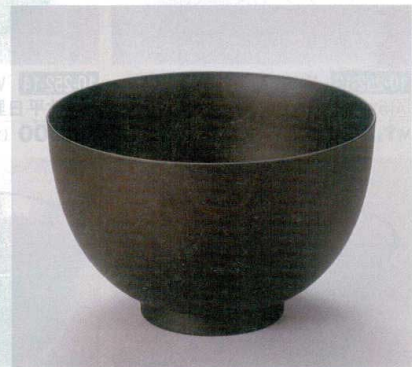
10-253-14 W-17-77 PET 5寸京木目井 総ダークブラウン ¥1,300 (14.7φ×9.5) 椀100 950cc