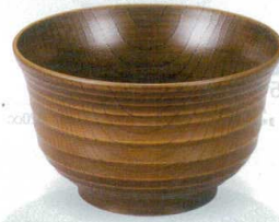
10-253-10 W-17-28 A 4.5寸千段木目椀 総栃刷毛目 ¥1,850 (13.5φ×8.2) 椀100 650cc