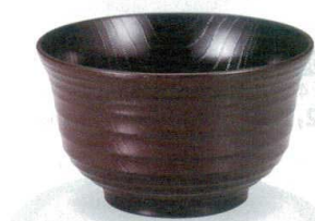
10-253-8 W-17-26 A 4.5寸千段木目椀 溜内黒 ¥1,200 (13.5φ×8.2) 椀100 650cc