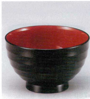
10-253-1 W-10-62 TA ロク口汁椀 黒内朱 ¥870 (11.4φ×7.1) 椀200 400cc