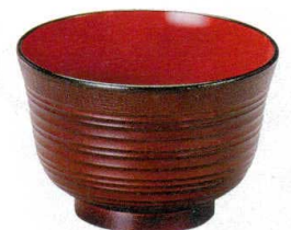
10-254-9 W-15-4 PET 羽反瀏布目筋汁椀 茶乾漆内朱 ¥900 (10.3φ×7 340cc) 梱200