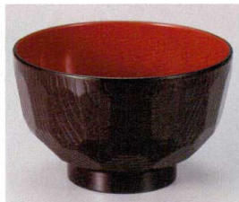
10-254-2 W-17-79 A 3.6寸亀甲汁椀 新溜 ¥350 (10.8φ×6.9 370cc) 梱200