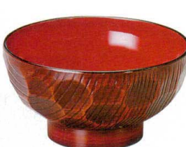
10-254-12 W-15-8 PET 4寸荒亀甲汁椀 栃内朱 ¥900 (11.7φ×6.2 340cc) 梱200