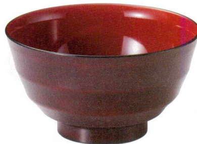
10-254-15 W-15-11 PET 5寸乱筋木彫井 赤栃内朱 ¥1,650 (15φ×8.5 780cc) 梱100