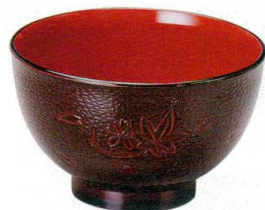
10-254-5 W-14-96 PET 3.7寸春秋汁椀 溜内朱 ¥900 (11.2φ×7 380cc) 梱200