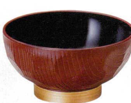
10-254-11 W-15-7 PET 4寸荒亀甲汁椀 吟朱つば金 ¥700 (11.7φ×6.2 340cc) 梱200