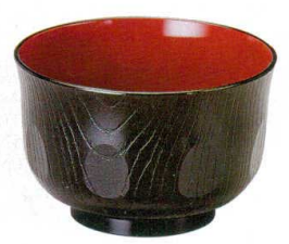
10-254-4 W-14-98 PET ひさご彫込汁椀 黒内朱 ¥680 (10.6φ×6.8 380cc) 梱200