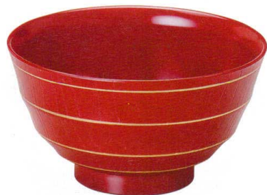
10-254-13 W-15-9 PET 5寸乱筋木彫井 銀朱金ライン ¥1,400 (15φ×8.5 780cc) 梱100