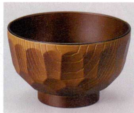
10-254-3 W-17-80 A 3.6寸亀甲汁椀 総消茶 ¥400 (10.8φ×6.9 370cc) 梱200