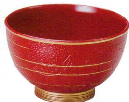
10-254-6 W-14-97 PET 3.7寸春秋汁椀 銀朱金冠ライン ¥950 (11.2φ×7 380cc) 梱200