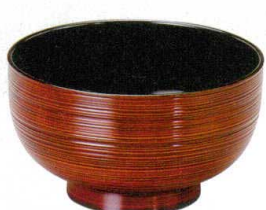
10-254-8 W-15-2 PET 3.8寸荒筋汁椀 栃内黒 ¥850 (11.1φ×6.4 390cc) 梱200