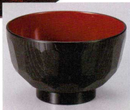
10-254-1 W-17-78 A 3.6寸亀甲汁椀 黒内朱 ¥330 (10.8φ×6.9 370cc) 梱200