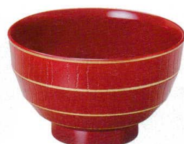
10-254-10 W-15-5 PET 3.8寸乱筋木彫汁椀 銀朱金ライン ¥950 (11.2φ×6.9 380cc) 梱200