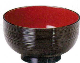
10-254-7 W-15-1 PET 3.8寸荒筋汁椀 黒内朱 ¥680 (11.1φ×6.4 390cc) 梱200