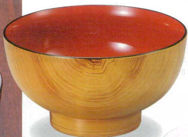
10-261-4 W-13-83 A うどん丼 花梨内朱 ¥1,600 (17φ×9.1) 楕100 1,100cc