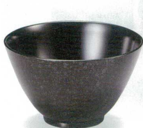
10-261-6 W-13-85 A 4.6寸ラックボール 黒油滴 ¥1,300 (14φ×8.5) 楕100 680cc