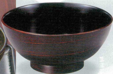
10-261-1 W-17-84 A ラーメン丼 溜根来内黒 ¥2,150 (19.5φ×8.7) 楕100 1,400cc