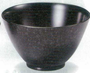
10-261-7 W-13-86 A 5.3寸ラックボール 黒油滴 ¥1,600 (15.8φ×9.5) 楕100 1,000cc