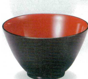
10-261-8 W-13-87 A 4.6寸ラックボール 新溜内朱 ¥1,100 (14φ×8.5) 楕100 680cc