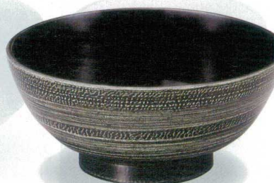
10-261-2 W-17-85 A ラーメン丼 黒に白流し内黒 ¥2,150 (19.5φ×8.7) 楕100 1,400cc