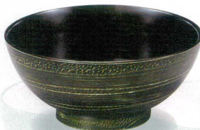
10-261-3 W-17-86 A ラーメン丼 緑に白流し内黒 ¥2,150 (19.5φ×8.7) 楕100 1,400cc