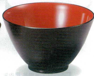
10-261-9 W-13-88 A 5.3寸ラックボール 新溜内朱 ¥1,350 (15.8φ×9.5) 楕100 1,000cc