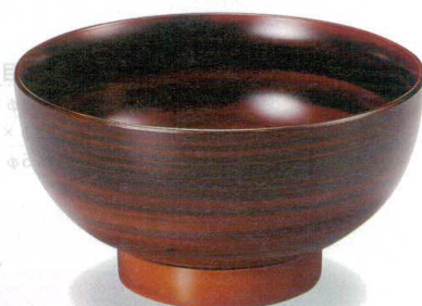
10-261-5 W-13-84 A うどん丼 総木目塗 ¥2,000 (17φ×9.1) 楕100 1,100cc