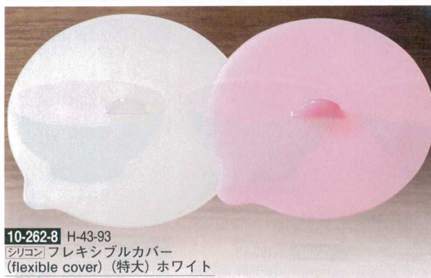
10-262-8 H-43-93 シリコン フレキシブルカバー (flexible cover) (特大) ホワイト ¥780 (18φ) 楕200