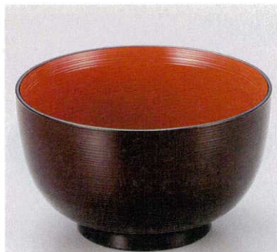
10-262-6 W-9-8 TA|4.5寸刷毛目羽反井 溜内朱 ¥950 (13.4φ×8) 楕100 770cc