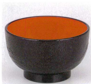
10-262-4 W-12-71 A|5寸桐木目井 黒内朱 ¥800 (14.5φ×8.5) 楕100 870cc