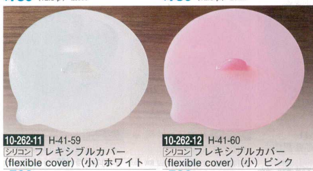
10-262-11 H-41-59 シリコン フレキシブルカバー (flexible cover) (小) ホワイト ¥730 (10φ) 楕300