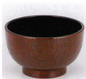
10-262-5 W-12-72 A|5寸桐木目井 トチ内黒 ¥1,000 (14.5φ×8.5) 楕100 870cc