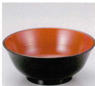
10-262-3 W-9-10 A|6寸刷毛目羽反井 黒内朱 ¥1,050 (18.5φ×7.7) 楕80 1,050cc