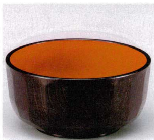
10-262-2 W-11-14 A|4.8寸亀甲木目井 溜内朱 ¥900 (14.4φ×7) 楕100 820cc