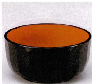
10-262-1 W-11-13 A|4.8寸亀甲木目井 黒内朱 ¥700 (14.4φ×7) 楕100 820cc