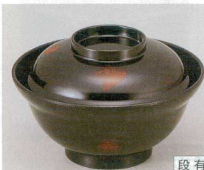
10-265-12 M4.7寸飯丼 曙 1-192-14A 蓋 ¥350 1-192-14 身 ¥570 (14.3φ×9) 椀80 350cc