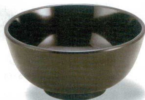
10-265-8 W-16-67 Mうどん丼黒(ST-1-1) ¥2,100 (16.3φ×7.9) 椀80 850cc