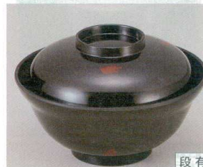
10-265-14 M5寸飯丼 曙 1-192-16A 蓋 ¥370 1-192-16 身 ¥600 (15.5φ×10) 椀80 470cc