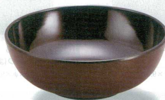
10-265-9 1-547-10 M多用丼溜(ST-2-2) ¥2,850 (20φ×7.2) 椀60 1,320cc