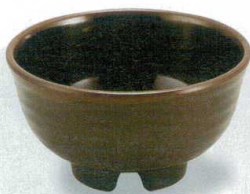
10-265-2 1-547-2 M種丼(天目) W-10BL ¥840 (14φ×7.5) 椀100 650cc