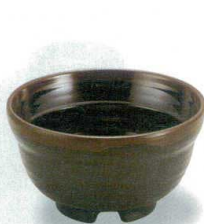
10-265-1 1-547-1 M小丼(天目) W-25BL ¥930 (12.1φ×6.8) 椀100 430cc