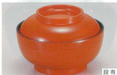
10-265-16 M5寸丸丼重 朱内黒 1-192-18A 蓋 ¥1,050 1-192-18 身 ¥1,400 (15φ×10.2) 椀60 600cc