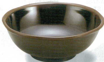
10-265-5 1-547-5 M7寸麺丼(天目) W-83BL ¥1,470 (20.4φ×7.6) 椀60 1,220cc