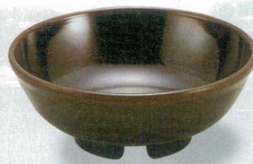
10-265-3 1-547-3 Mミニ麺(天目) W-40BL ¥940 (15.6φ×6) 椀80 600cc