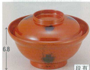
10-265-11 M4.7寸飯丼 根来 1-192-13A 蓋 ¥350 1-192-13 身 ¥570 (14.3φ×9) 椀80 350cc