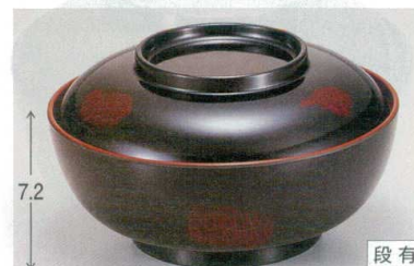
10-265-17 M6寸丸丼重 曙内朱 1-192-19A 蓋 ¥1,400 1-192-19 身 ¥1,500 (17.9φ×10.4) 椀50 950cc