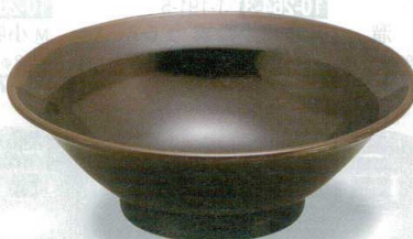
10-265-6 1-547-6 M8寸麺丼(天目) W-179BL ¥1,680 (21φ×7.3) 椀60 1,200cc