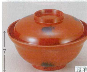
10-265-13 M5寸飯丼 根来 1-192-15A 蓋 ¥370 1-192-15 身 ¥600 (15.5φ×10) 椀80 470cc