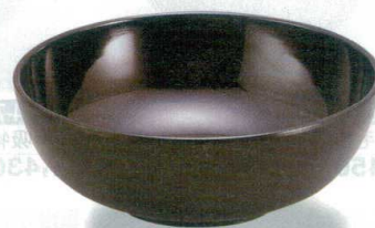
10-265-10 1-547-9A M多用丼黒(ST-2-3) ¥2,400 (20φ×7.2) 椀60 1,320cc