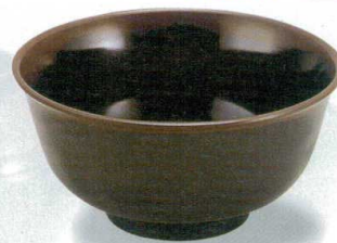
10-265-4 1-547-4 Mそば丼(天目) W-82BL ¥1,470 (17.5φ×8.6) 椀80 1,220cc