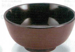
10-265-7 1-547-8 Mうどん丼溜(ST-1-2) ¥2,450 (16.3φ×7.9) 椀80 850cc