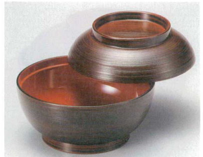
10-275-9 TA 4.5寸刷毛目椀 栃内朱 W-13-8 ¥2,000 (13.9φ×9.2) 椀100 410cc