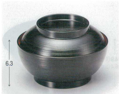
10-275-7 TA 4.5寸刷毛目椀 黒内朱 W-13-6 ¥1,800 (13.9φ×9.2) 椀100 410cc