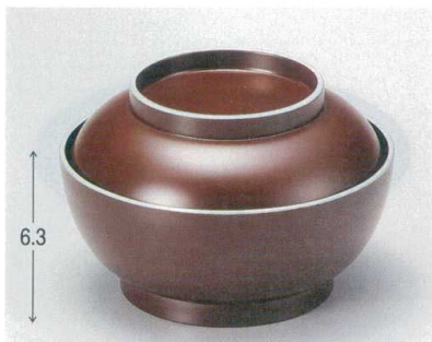
10-275-10 TA 4.5寸若平椀 銀朱天銀 W-13-9 ¥1,950 (13.9φ×9.2) 椀100 410cc