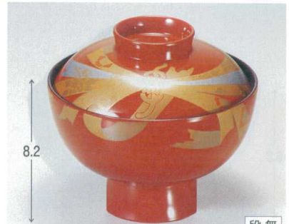
10-275-3 TM 4.2寸雑煮椀 朱にのし S・H塗 W-17-87 ¥6,000 (12.6φ×11.4) 椀50 470cc