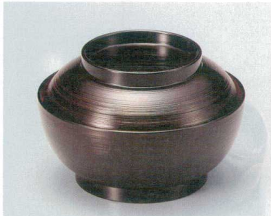
10-275-8 TA 4.5寸刷毛目椀 溜内朱 W-13-7 ¥1,900 (13.9φ×9.2) 椀100 410cc