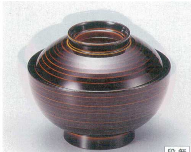
10-275-2 TM 4.5寸乱引椀 漆調朱合春慶 W-13-13 ¥3,100 (13.7φ×10.7) 椀100 600cc