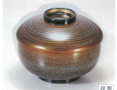
10-275-6 TM 三笠煮物椀 グレー金つむぎ S・H塗 1-199-4 ¥5,600 (13φ×10) 椀100 500cc