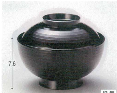
10-275-1 TM 4.5寸乱引椀 黒P.T塗 W-13-12 ¥2,800 (13.7φ×10.7) 椀100 600cc