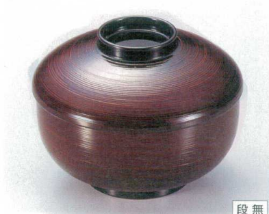
10-275-5 TM 三笠煮物椀 溜刷毛目 W-6-75 ¥3,150 (13φ×10) 椀100 500cc