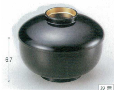
10-275-4 TM 三笠煮物椀 黒内朱つば金 W-10-11 ¥2,900 (13φ×10) 椀100 500cc