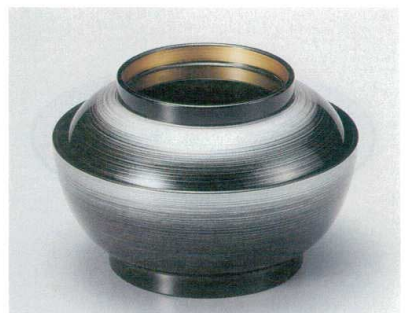
10-275-12 TA 4.5寸若平椀 黒かすみつば金 W-13-11 ¥3,200 (13.9φ×9.2) 椀100 410cc