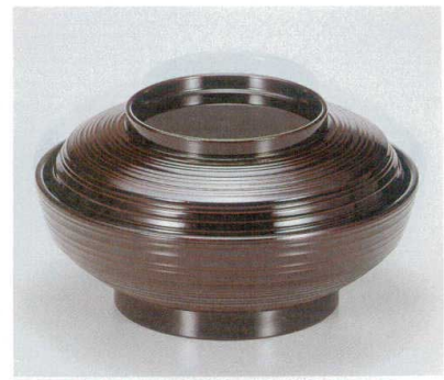
10-283-14 TA 5.5寸線筋平煮物椀 溜内黒 W-2-63 ¥2,550 (16.5φ×9.6) 椀50 500cc