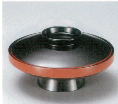
10-283-5 M 5.5寸駒型煮物椀 黒洩朱 W-9-89 ¥2,800 (16φ×8.2) 椀60 600cc