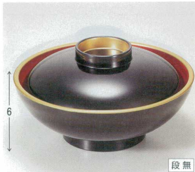
10-283-1 A 5.5寸風味椀 黒内朱つば天金 1-204-1 ¥1,800 (16.4φ×9) 椀60 600cc