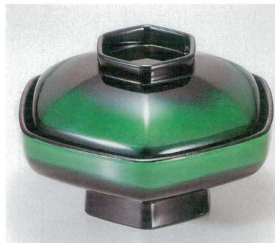
10-283-8 TA 六角煮物椀 グリーンカスミ 1-204-10 ¥3,800 (16φ×9.9) 椀60 530cc