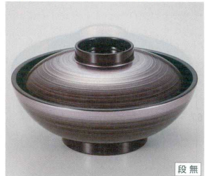
10-283-3 A 5.5寸風味椀 茶銀刷毛目 W-17-35 ¥3,000 (16.4φ×9) 椀60 600cc