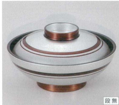
10-283-2 A 5.5寸風味椀 高銀溜ライン W-17-34 ¥2,400 (16.4φ×9) 椀60 600cc