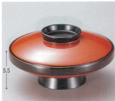
10-283-4 M 5.5寸駒型煮物椀 朱洩黒 W-7-4 ¥2,800 (16φ×8.2) 椀60 600cc