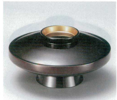
10-283-6 M 5.5寸駒型煮物椀 溜つば金 W-9-90 ¥3,200 (16φ×8.2) 椀60 600cc