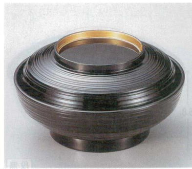
10-283-12 TA 5.5寸線筋平煮物椀 黒つば金 W-7-9 ¥2,450 (16.5φ×9.6) 椀50 500cc