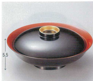
10-283-7 TM 6.2寸平駒煮物椀 黒内朱つば内金 W-7-5 ¥4,150 (18.8φ×8) 椀60 450cc