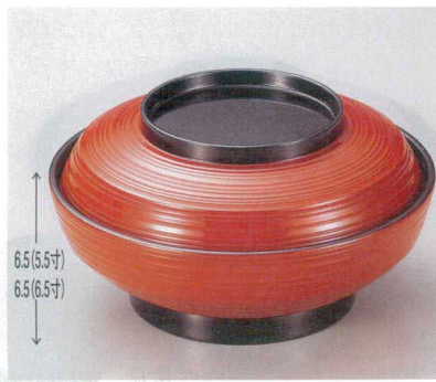
10-283-10 TA 5.5寸線筋平煮物椀 朱つば黒 W-7-7 ¥2,400 (16.5φ×9.6) 椀50 500cc