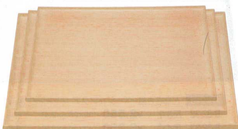
10-3-4 A 長手タイコ隅丸盆 ラバーウッド調 ノンスリップ加工