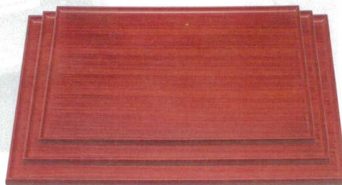
10-3-3 A 長手タイコ隅丸盆 赤茶刷毛目 艶消ノンスリップ加工