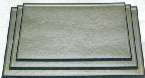
10-3-2 A 長手タイコ隅丸盆 グリーン雲流淵黒 ノンスリップ加工