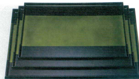
10-3-7 A 長手タイコ隅丸盆 緑帯銀 S・S塗|ノンスリップ加工