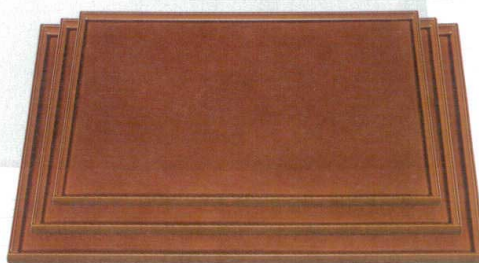
10-3-5 A 長手タイコ隅丸盆 漆調春慶底黒塗