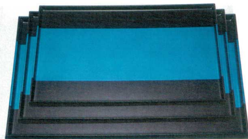
10-3-6 A 長手タイコ隅丸盆 青帯銀 S・S塗|ノンスリップ加工