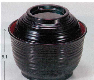
10-304-11 M 羽反千筋丼椀 黒内朱 1-218-10 ¥2,300 (15φ×13.5) 椀50 720cc