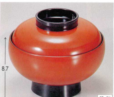
10-304-10 M 5寸多宝丼椀 朱つば黒 1-213-11 ¥3,800 (14.8φ×12.5) 椀50 700cc