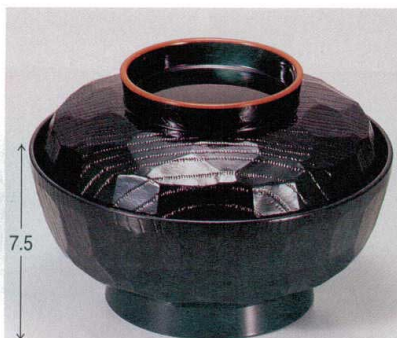
10-304-8 M 5.5寸亀甲丼 黒天朱 [メラミン] 1-219-8 ¥3,000 (16.4φ×12) 椀50 600cc