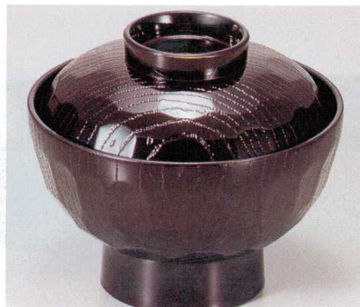
10-304-5 A (大) 亀甲丼 溜 1-219-12 ¥1,600 (15.6φ×13.8) 椀50 580cc