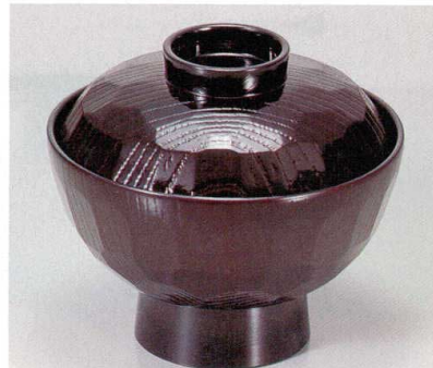
10-304-2 M (中) 亀甲丼椀 溜 1-219-2 ¥1,800 (13.3φ×11.7) 椀50 380cc