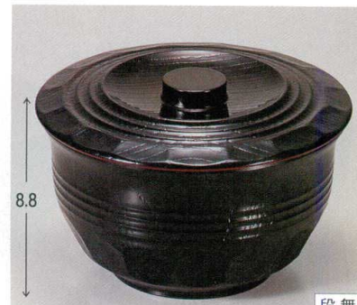
10-304-3 M 5寸亀甲木目椀 黒内朱 1-219-3 ¥1,700 (15.2φ×9.8) 椀50 840cc