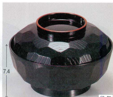
10-304-9 A 6寸亀甲丼 黒天朱 1-219-9 ¥2,500 (17.4φ×11.4) 椀50 900cc