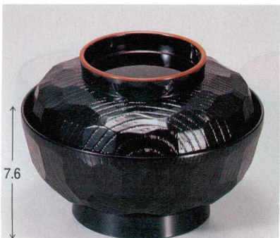
10-304-7 M 5寸亀甲丼 黒天朱 [メラミン] 1-219-7 ¥2,350 (15φ×11) 椀50 490cc