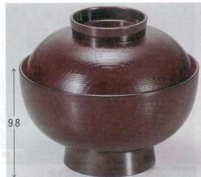
10-321-9 A 保温井 溜千筋内朱 1-193-9 ¥4,200 (17.6φ×14.7) 椀50 660cc