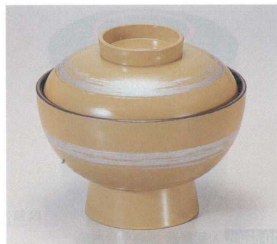
10-321-3 A 保温吸椀 クリーム銀一筆内黒塗 1-193-3 ¥2,650 (12φ×10.5) 椀100 230cc