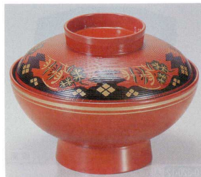
10-321-8 A 保温煮物椀 朱千筋正方寺金ライン 1-193-8 ¥4,350 (17.5φ×13) 椀50 510cc