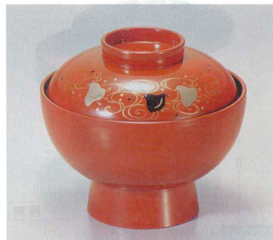
10-321-4 A 保温吸椀 朱波千鳥内黒塗 1-193-4 ¥3,250 (12φ×10.5) 椀100 230cc