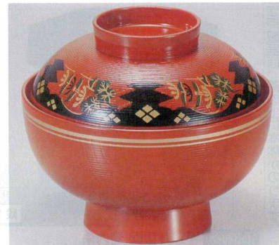
10-321-10 A 保温井 朱千筋正方寺金ライン 1-193-10 ¥4,450 (17.6φ×14.7) 椀50 660cc