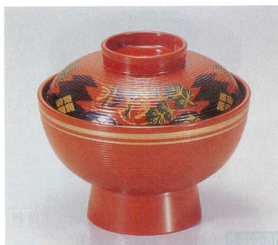
10-321-2 A 保温千筋吸椀 朱正方寺金ライン 1-193-2 ¥2,750 (12φ×10.3) 椀100 230cc

【注意】 ◆洗浄機のご使用はさけて、手洗にてお願い致します。乾燥機の使用は、絶対にさけて下さい。