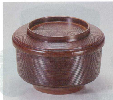
10-321-6 A 保温飯器 栃千筋内朱 1-193-6 ¥2,850 (14.1φ×9.5) 椀100 540cc