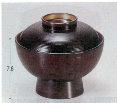
10-321-1 A 保温千筋吸椀 溜内朱つば金 1-193-1 ¥2,450 (12φ×10.3) 椀100 230cc