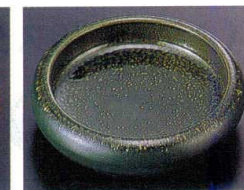
10-416-4 1-510-4 A.D.Xタイコ型のぞき 黒内朱 ¥490 (9.5φ×2.5) 櫃200