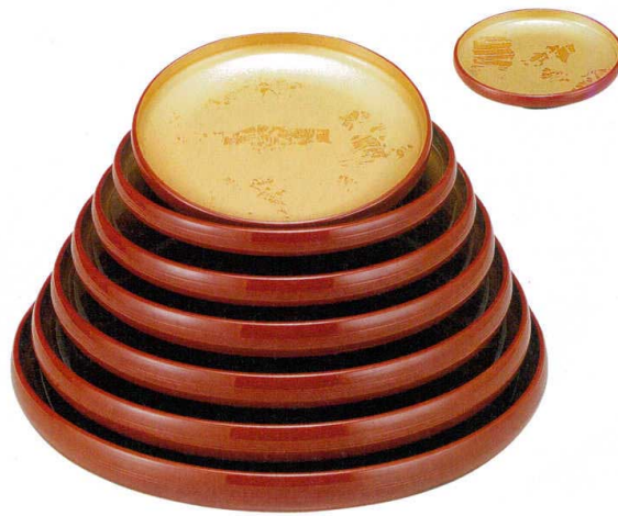
10-422-2 A 一休鉢 色紙金箔測朱 S・H塗