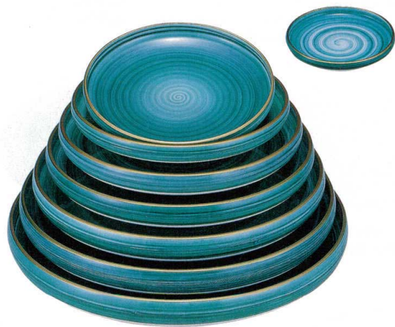
10-422-3 A 一休鉢 清流天金