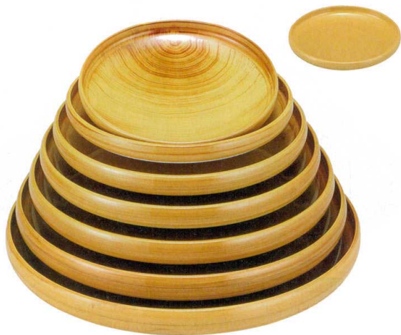
10-422-1 A 一休鉢 花梨塗