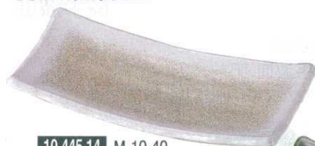
10-445-14 M-10-40 TA 羽反焼物皿 白唐津 ¥2,800 (22×9.6×3.3) 梱80