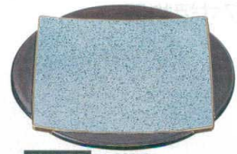
10-445-7 1-603-9 TA 5.5寸色紙皿 吹墨測金 ¥2,900 (17φ×3.4) 梱80