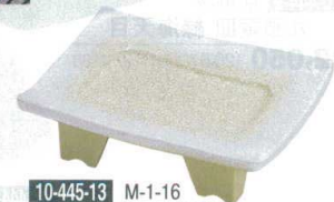
10-445-13 M-1-16 A 高足盛器 白唐津 ¥1,900 (16×11.5×4.7) 梱80