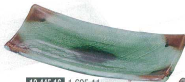
10-445-16 1-605-11 TA 羽反焼物皿 新織部 ¥2,750 (22×9.6×3.3) 梱80