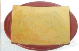
10-445-5 M-10-41 TA 5.5寸色紙皿 色紙金箔測朱 S-H塗 ¥2,700 (17φ×3.4) 梱80