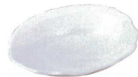
10-445-9 1-686-4 AC あわび盛皿6寸 白パール H-C塗 ¥1,350 (17.6×14×4.2) 梱80