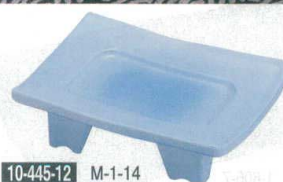
10-445-12 M-1-14 A 高足盛器 青磁 ¥1,500 (16×11.5×4.7) 梱80