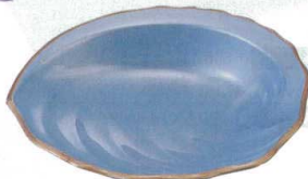
10-445-10 1-687-14 A あわび盛皿6寸 ブルー真珠 クリーン塗 ¥2,700 (17.6×14×4.2) 梱80