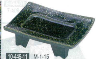
10-445-11 M-1-15 A 高足盛器 織部 ¥1,600 (16×11.5×4.7) 梱80