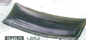
10-445-15 1-605-6 TA 羽反焼物皿 織部 ¥2,350 (22×9.6×3.3) 梱80