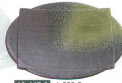
10-445-6 1-603-8 TA 5.5寸色紙皿 岩織部 ¥2,650 (17φ×3.4) 梱80