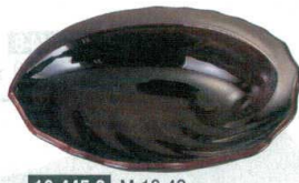
10-445-8 M-10-42 A あわび盛皿6寸 溜 ¥1,850 (17.6×14×4.2) 梱80