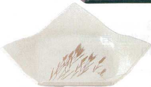
10-445-3 M-10-31 A 結び折皿 クリーム麦 ¥2,950 (26×20.7×5.5) 梱60