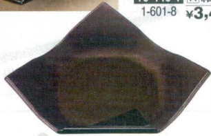
10-445-2 M-10-28 A 結び折皿 新溜 ¥2,100 (26×20.7×5.5) 梱60