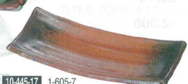
10-445-17 1-605-7 TA 羽反焼物皿 信楽塗 ¥2,400 (22×9.6×3.3) 梱80