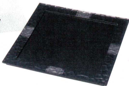
10-464-2 A 尺0寸角溶岩懐石プレート M-31-93 黒銀刷毛 ¥3,000 (30.3×30.3×1.4) 梱40