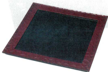
10-464-1 A 尺0寸角溶岩懐石プレート M-31-92 溜透き ¥2,700 (30.3×30.3×1.4) 梱40