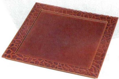
10-464-4 A 尺0寸角溶岩懐石プレート M-31-95 漆調春慶底黒塗 S・S塗 ¥4,500 (30.3×30.3×1.4) 梱40