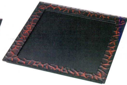
10-464-3 A 尺0寸角溶岩懐石プレート M-31-94 消曙洩黒 ¥3,650 (30.3×30.3×1.4) 梱40