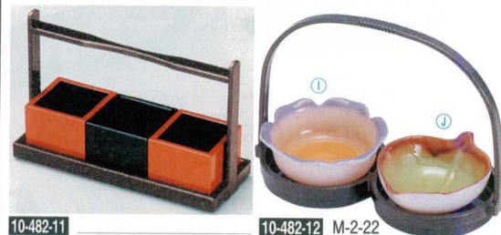
10-482-11 M-2-18 A長角手提盛器 梨地 ¥900 (16.9×6.4×11.4) 櫃100 M-2-19 Aマス珍味入れ 朱 ¥500 (5.2×5.2×4.1) 櫃100 M-2-20 Aマス珍味入れ 黒 ¥500 (5.2×5.2×4.1) 櫃100 10-482-12 M-2-22 Aめがね手提盛器 梨地 ¥1,050 (18.7×9.1×14.1) 櫃100 I 1-338-11 M花鉢 オレンジ紫 ¥950 (9.1×9.1×3.7) 櫃200 J 1-338-8 Mこの葉鉢 織部 ¥1,050 (10×8.1×3.5) 櫃200