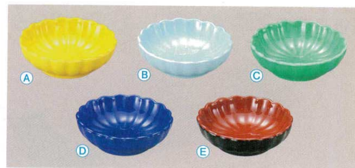
10-482-4 A M-18-33 菊豆皿 (樹脂製) 黄塗 ¥480 (5.8φ×1.8) 櫃200 B M-18-34 菊豆皿 (樹脂製) 青磁塗 ¥480 (5.8φ×1.8) 櫃200 C M-18-35 菊豆皿 (樹脂製) ヒワグリーン塗 ¥480 (5.8φ×1.8) 櫃200 D M-18-36 菊豆皿 (樹脂製) 瑠璃塗 ¥480 (5.8φ×1.8) 櫃200 E M-18-37 菊豆皿 (樹脂製) 黒内朱 ¥480 (5.8φ×1.8) 櫃200