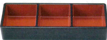
10-482-5 A天切三点珍味箱 黒内朱天黒 M-23-45 ¥1,000 (19.3×6.8×3.7)