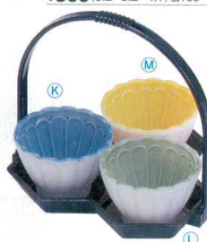
10-482-13 M-2-21 A六角珍味手揚げ盛器 梨地 ¥550 (10.8×10.5×11.2) 櫃100 K 1-339-29 M菊千代久 青磁 ¥730 (5.2φ×3.6) 櫃200 L 1-339-30 M菊千代久 グリーン ¥730 (5.2φ×3.6) 櫃200 M M-2-21C M菊千代久 黄 ¥730 (5.2φ×3.6) 櫃200