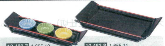
10-483-7 1-655-10 A (小) 笹舟盛皿 黒天朱 本体 ¥1,350 (27.2×9.2×3.5) 欄100