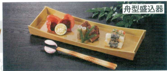
10-483-6 M-7-63 A 尺0寸舟型盛込器 白木 ¥1,400 (31.7×10.9×3.3) 欄80