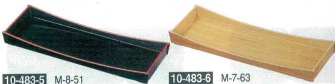
10-483-5 M-8-51 A 尺0寸舟型盛込器 黒天朱 ¥1,100 (31.7×10.9×3.3) 欄80