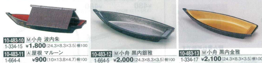
10-483-10 M 小舟 波内朱 1-334-15 ¥1,800 (24.3×8.3×3.5) 欄100