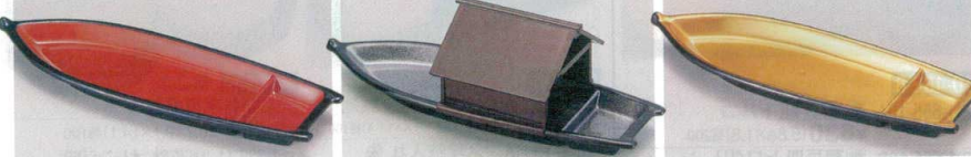
10-483-14 A 笹舟 黒内朱 1-664-8 ¥2,000 (35.2×11.3×3.4) 欄60