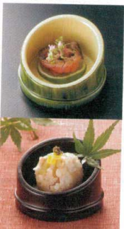
10-484-23 M-14-29 A(小)竹珍味 若竹 ¥700 (4.2φ×3.5)