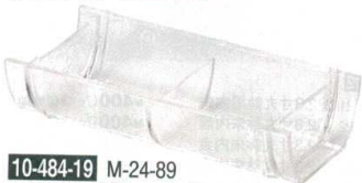
10-484-19 M-24-89 AC竹取盛器 二点盛り 透明 ¥1,700 (21×10.1×4.8) 梱80