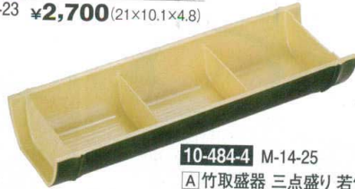
10-484-4 M-14-25 A竹取盛器 三点盛り 若竹 ¥3,000 (29.8×10.1×4.8)