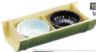
10-484-1 A竹取盛器 二点盛り 若竹 M-14-23 ¥2,700 (21×10.1×4.8)