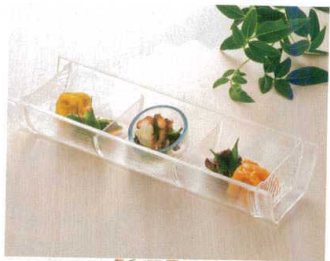
10-484-22 M-24-92 AC竹取盛器 三点盛り ブルーぼかし ¥2,850 (29.8×10.1×4.8) 梱60