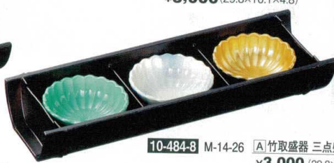
10-484-8 M-14-26 A竹取盛器 三点盛り スス竹 ¥3,000 (29.8×10.1×4.8)