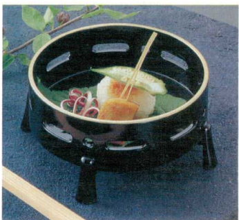
10-503-18 1-327-1 Aミニ丸透かし盛器 朱天金 ¥1,150 (11.4φ×3.9) 櫃100