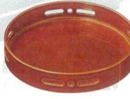
10-503-15 1-9-5 A5.5寸丸透かし盛器 漆調春慶底黒塗 ¥2,000 (17φ×3.2) 櫃60