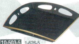
10-503-5 1-626-5 A四方透かし皿 黒天金 ¥1,800 (22×22×3.5) 櫃50