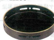
10-503-11 1-640-4 A5.5寸丸透かし盛器 黒天金 ¥1,450 (17φ×3.2) 櫃60