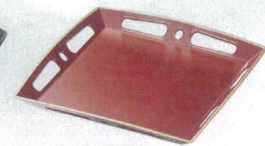
10-503-8 M-7-17 A新四方透かし皿 銀朱天金 ¥900 (17.4×17.4×2) 櫃100