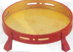
10-503-23 1-640-10 A6.5寸丸透かし足付盛器 朱内色紙金箔 S・H 塗 ¥3,300 (23φ×5.7) 櫃50