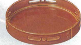
10-503-17 1-9-7 A7寸丸透かし盛器 漆調春慶底黒塗 ¥2,750 (20.3φ×3.6) 櫃40