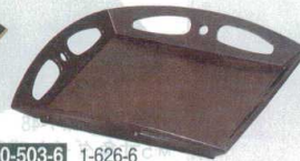
10-503-6 1-626-6 A四方透かし皿 溜 ¥2,100 (22×22×3.5) 櫃50