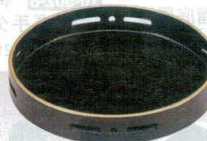
10-503-12 1-640-5 A6.5寸丸透かし盛器 黒天金 ¥1,550 (19φ×3.3) 櫃50