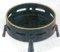
10-503-22 1-640-3 Aミニ丸透かし足付盛器 黒天金 ¥1,800 (13.3φ×5.5) 櫃100