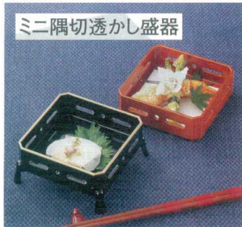
ミニ隅切透かし盛器