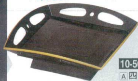
10-503-7 1-626-7 A四方透かし皿 黒天金足付 足はワンタッチではずせます ¥2,250 (22×22×6.8) 櫃30