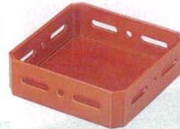
10-503-3 C-2-68 Aミニ隅切透かし盛器 春慶 ¥1,400 (11.3×11.3×4) 櫃100