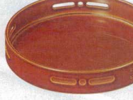
10-503-16 1-9-6 A6.5寸丸透かし盛器 漆調春慶底黒塗 ¥2,350 (19φ×3.3) 櫃50