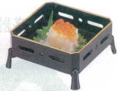
10-503-4 1-627-3 Aミニ隅切透かし足付盛器 黒天金 ¥1,850 (12.3×12.3×5.1) 櫃100