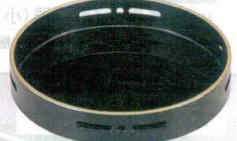
10-503-13 1-640-6 A7寸丸透かし盛器 黒天金 ¥1,650 (20.3φ×3.6) 櫃40