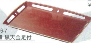
10-503-9 M-7-18 A新長手四方透かし皿 銀朱天金 ¥1,200 (26×17.5×2) 櫃100