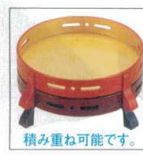
積み重ね可能です。