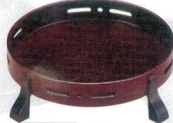
10-503-24 1-640-11 A6.5寸丸透かし足付盛器 溜底黒塗 S・S 塗 ¥3,800 (23φ×5.7) 櫃50