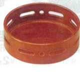
10-503-14 1-9-4 Aミニ丸透かし盛器 漆調春慶底黒塗 ¥1,850 (11.4φ×3.9) 櫃100