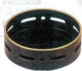
10-503-10 1-327-2 Aミニ丸透かし盛器 黒天金 ¥1,150 (11.4φ×3.9) 櫃100