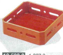
10-503-2 1-327-3 Aミニ隅切透かし盛器 朱天金 ¥1,200 (11.3×11.3×4) 櫃100