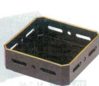
10-503-1 1-327-4 Aミニ隅切透かし盛器 黒天金 ¥1,200 (11.3×11.3×4) 櫃100