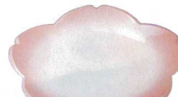
10-516-23 M-8-45 A (大) さくら皿 ピンクぼかし ¥1,150 (24.5×24×2.4) 梱100