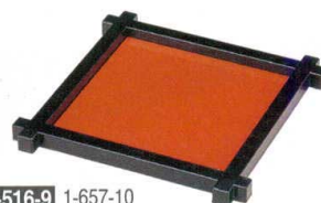
10-516-9 1-657-10 A 井桁皿 黒枠皿朱裏黒木目 ¥1,300 (17.5×17.5×3) 梱100