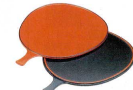
10-516-11 1-657-7 A うちわ両面皿 朱天黒/黒千筋天朱 ¥1,100 (27×21.3×0.7) 梱200