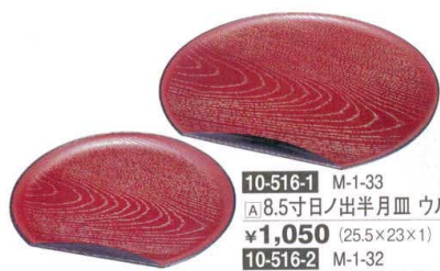
10-516-1 M-1-33 A 8.5寸日ノ出半月皿 ウルミ天黒 ¥1,050 (25.5×23×1) 梱80 10-516-2 M-1-32 A 6寸日ノ出半月皿 ウルミ天黒 ¥700 (17.9×16.1×0.9) 梱100