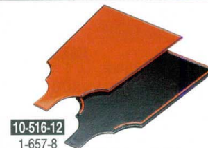
10-516-12 1-657-8 A 新はご板 朱天黒/黒千筋天朱 ¥1,100 (30×17.5×0.7) 梱150