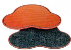
10-516-10 1-657-5 A 松皿 黒木目天朱/朱天黒 ¥1,300 (25.3×15.7×0.7) 梱200