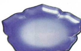
10-516-15 M-8-19 M 7寸桔梗皿 紫銀ぼかし ¥2,150 (21×21×1.9) 梱100