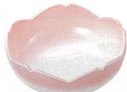
10-516-17 M-8-42 A 桜小鉢 ピンクぼかし ¥650 (11φ×4.2) 梱200