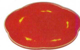
10-516-16 M-8-24 M 梅型一文字皿 別甲 ¥2,150 (21.5φ×2.3) 梱80