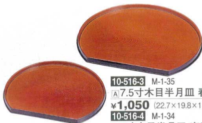
10-516-3 M-1-35 A 7.5寸木目半月皿 春慶測黒 ¥1,050 (22.7×19.8×1.5) 梱100 10-516-4 M-1-34 A 6寸木目半月皿 春慶測黒 ¥850 (18×15.9×0.9) 梱100