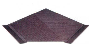
10-516-13 1-657-9 A むすび皿 溜 ¥1,100 (29.5×18×1.1) 梱150