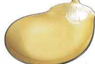
10-516-18 M-8-49 A なす皿 金測黒 ¥550 (15.8×12×1.8) 梱200