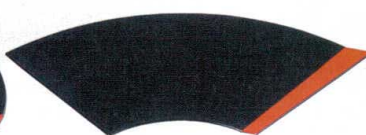
10-516-8 1-657-12 A 尺2寸扇面隅折皿 黒測朱 ¥1,000 (35.6×15.5×1.5) 梱80