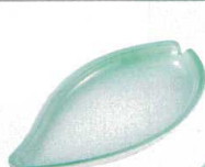
10-516-20 M-8-43 A (小) 桜葉皿 グリーンぼかし ¥550 (14.4×7.6×1.2) 梱200