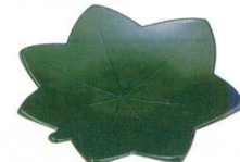
10-516-19 M-2-10 A かねで皿 グリーン ¥550 (16×14×1.5) 梱200