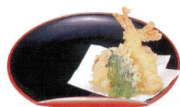
10-516-6 1-653-11 A 半月皿 黒天朱 ¥1,300 (22.9×20.5×2.7) 梱100