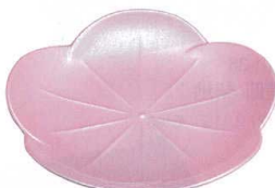
10-516-14 1-646-4 M 花皿 ピンク真珠 ¥1,950 (20.5×19.8×3) 梱60