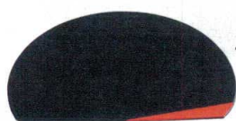
10-516-7 1-657-11 A 8寸半月隅折千筋皿 黒測朱 ¥750 (24.2×17.8×1.3) 梱150