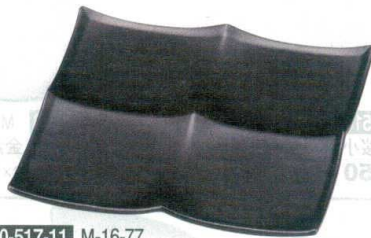
10-517-11 M-16-77 A 8寸角四季彩皿 黒石目 ハード塗 ¥2,000 (24.3×24.3×2.6) 櫃80