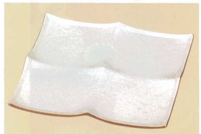
10-517-13 M-16-79 A 8寸角四季彩皿 クリームアックア測金 ¥2,750 (24.3×24.3×2.6) 櫃80