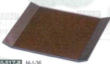
10-517-8 M-1-36 A 9寸羽反盛皿 梨地 ¥800 (27.2×21.2×1.7) 櫃100