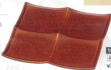
10-517-12 M-16-80 A 8寸角四季彩皿 漆調春慶底黒塗 ¥3,200 (24.3×24.3×2.6) 櫃80