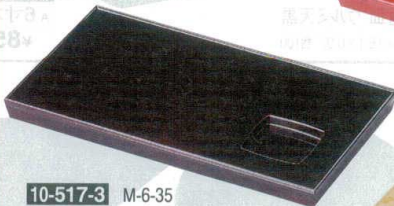
10-517-3 M-6-35 A 9.2寸長角盛器 溜底黒塗 S.S塗 ¥2,500 (28×16×2) 櫃60