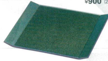
10-517-10 M-1-37 A 9寸羽反盛皿 グリーンパール ¥800 (27.2×21.2×1.7) 櫃100