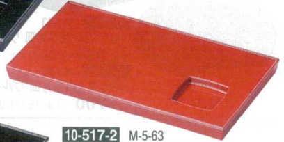
10-517-2 M-5-63 A 9.2寸長角盛器 本朱塗 ¥1,500 (28×16×2) 櫃60