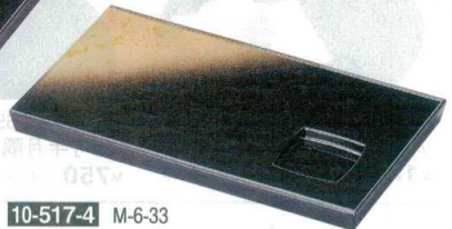
10-517-4 M-6-33 A 9.2寸長角盛器 パール色紙金箔 S.H塗 ¥2,200 (28×16×2) 櫃60