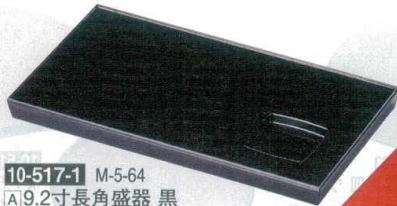
10-517-1 M-5-64 A 9.2寸長角盛器 黒 ¥1,350 (28×16×2) 櫃60