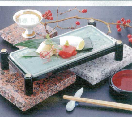
10-533-13 1-630-10 陶天平皿用陶板 青磁春秋 ¥2,450 (22.8×10.2×0.8) 柵40