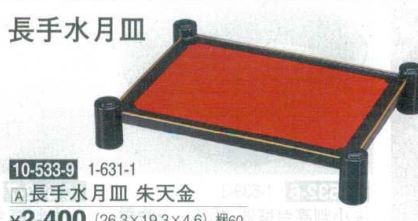
10-533-9 1-631-1 A長手水月皿 朱天金 ¥2,400 (26.3×19.3×4.6) 柵60