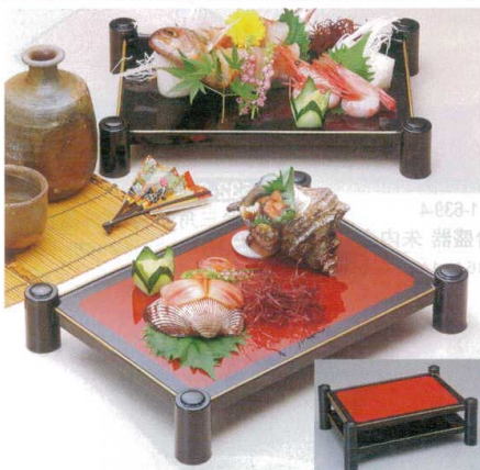
10-533-8 1-630-3 M角水月板 溜 (本体別売) ¥2,200 (16.9×16.9×2.1) 柵50