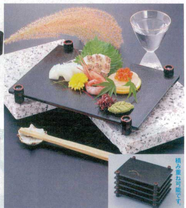
10-533-10 1-631-2 A長手水月皿 黒天金 ¥2,250 (26.3×19.3×4.6) 柵60