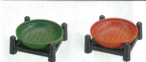
10-533-2 1-630-22 A丸竹皿 グリーン (脚別売) ¥850 (13.2φ×3.5) 柵200