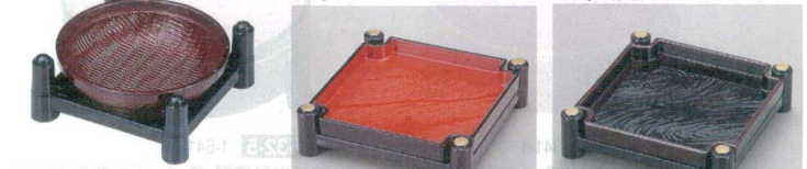
10-533-3 1-630-23 A丸竹皿 春慶 (脚別売) ¥1,100 (13.2φ×3.5) 柵200