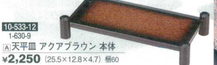
10-533-12 1-630-9 A天平皿 アクアブラウン 本体 ¥2,250 (25.5×12.8×4.7) 柵60