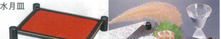
10-533-5 1-630-1 A角水月皿 黒天金 本体 ¥1,600 (17.6×17.6×4.9) 柵60