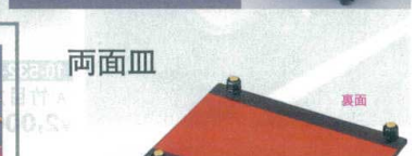
10-533-11 1-630-8 A天平皿 黒天金 本体 ¥1,850 (25.5×12.8×4.7) 柵60