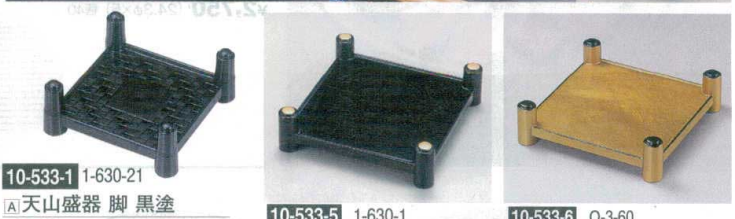
10-533-1 1-630-21 A天山盛器 脚 黒塗 ¥950 (13×13×5.3) 柵80