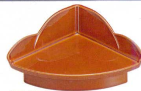
10-534-3 1-644-2 A 元禄盛器 金雅測朱 ¥2,900 (22.8×18.3×8.2) 欄60