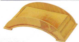
10-534-12 A 太鼓橋 朱 本体のみ 1-634-4 ¥1,650 (25.5×14.3×7.3) 欄60