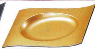
10-534-1 M-6-82 A 風情盛器 銀透き ¥2,750 (24.1×16.3×3) 欄50