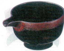
10-537-6 M-12-27 A|布張片口鉢 曙 ¥1,750 (14.5×11.8×7.9) 櫃60 380cc