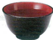
10-537-16 M-18-31 A|丸羽反小鉢 茶パール内朱 ¥650 (9.3φ×5.4) 櫃100