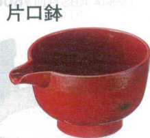
10-537-5 M-12-26 A|布張片口鉢 根来 ¥1,550 (14.5×11.8×7.9) 櫃60 380cc