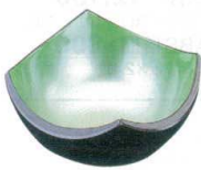
10-537-9 1-677-21 M(小)3.2寸四方上り鉢 グリーンかすみ ¥1,200 (9.8×9.8×4.5) 櫃150