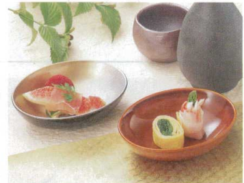
10-537-13 A|小判鉢 漆調総春慶塗 M-8-34 ¥1,350 (10.7×8.5×2.6) 櫃300