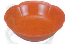
10-537-1 M-2-12 木質(大)朝顔鉢 総洗朱 ¥1,400 (13.4×13.4×3.7) 櫃100