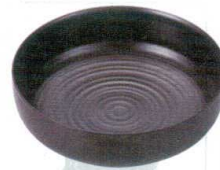
10-537-7 M-33-90 A|5寸木目乱筋小鉢 艶消新溜 ¥1,050 (15.5φ×4.5)