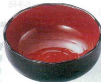
10-537-21 M-8-38 M|吉野小鉢 黒内朱天黒 ¥1,050 (9.5φ×4.3) 櫃200