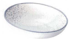
10-537-18 M-11-75 A|小判鉢 吹墨 ¥920 (10.7×8.5×2.6) 櫃300