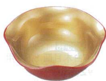
10-537-15 M-8-35 A|3.2寸梅小鉢 朱内金 ¥430 (9.5×9.2×3.6) 櫃200