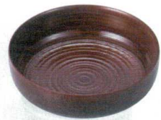
10-537-8 M-33-91 A|5寸木目乱筋小鉢 栃 ¥1,650 (15.5φ×4.5)