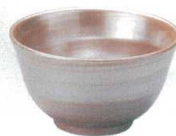
10-537-17 M-18-32 A|丸羽反小鉢 銀かすり ¥1,450 (9.3φ×5.4) 櫃100