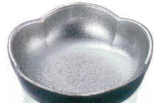
10-537-4 M-8-37 M(大)梅小鉢 銀石目 ¥1,200 (11.2φ×3.5) 櫃200