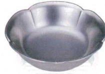
10-537-2 M-2-13 木質(大)朝顔鉢 銀透き ¥2,450 (13.4×13.4×3.7) 櫃100