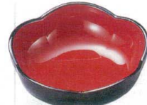
10-537-3 M-8-36 M(大)梅小鉢 黒内朱天黒 ¥900 (11.2φ×3.5) 櫃200