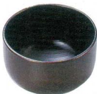
10-537-19 M-8-40 A|木目小鉢 溜内黒 ¥650 (9φ×5.9) 櫃200