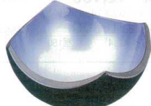
10-537-10 1-677-22 M(中)3.8寸四方上り鉢 紫かすみ ¥1,600 (11.7×11.7×5.8) 櫃100