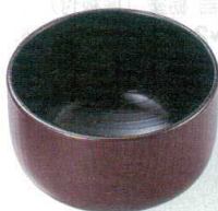
10-537-20 M-8-41 A|木目小鉢 栃内黒 ¥650 (9φ×5.9) 櫃200