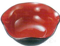
10-537-14 M-2-8 A|3.2寸梅小鉢 黒内朱天黒 ¥380 (9.5×9.2×3.6) 櫃200