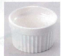
10-537-23 M-33-92 A|ABS スプレ白 ¥400 (6φ×3.7) 櫃180