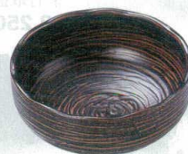
10-537-22 M-8-39 M|吉野小鉢 荒挽 ¥1,750 (9.5φ×4.3) 櫃200