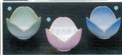
陶チュリップ珍味(6φ×4.4)