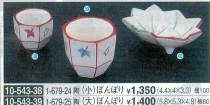
10-543-38 1-679-24 陶(小)ぼんぼり ¥1,350 (4.4×4×3.3) 標100