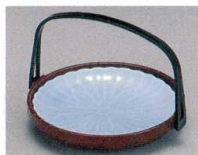
10-550-4 1-618-4 陶 (小)手付かご用 菊皿 青磁 (本体別) ¥1,600 (16.2φ×2.2) 楕50