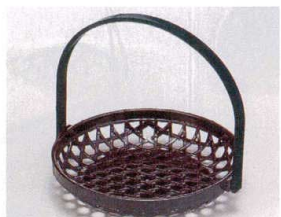
10-550-10 1-618-9 A 6寸竹かご マロン (折畳式) ¥850 (17.9φ×17) 楕150