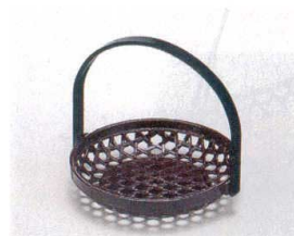
10-550-9 1-618-8 A 5寸竹かご マロン (折畳式) ¥700 (14.8φ×14.4) 楕200