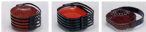
10-550-1 1-618-1 A (小)手付かご 朱天黒 全面塗 (折畳式) ¥1,150 (19.7×18×13.5) 楕120