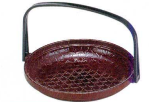
10-550-7 1-618-7 A (大)手付かご 春慶 全面塗 (折畳式) ¥1,600 (23×21×15.5) 楕60