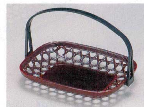
10-550-14 1-618-16 A 7寸長手手提かご 溜 (折畳式) ¥1,000 (20.6×15×14.3) 楕150