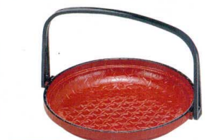
10-550-6 1-618-6 A (大)手付かご 朱天黒 全面塗 (折畳式) ¥1,500 (23×21×15.5) 楕60