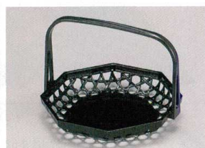
10-550-16 1-618-11 A 八角竹かご 黒 (折畳式) ¥1,050 (19.3×17.9×14.2) 楕100