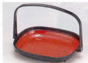
10-550-15 1-619-17 A 小判手付かご 黒内朱黒 全面塗 (折畳式) ¥1,900 (23×18×16) 楕50