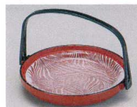
10-550-3 1-618-3 [ガラス] (小)手付かご用 ガラス鉢 雪波 (本体別) ¥4,600 (16.3φ×2.1) 楕40