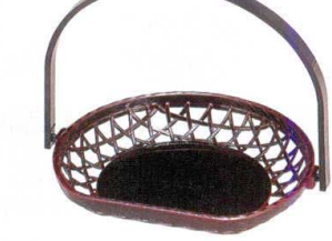
10-550-12 1-619-12 A 半月手付かご 溜 (折畳式) ¥1,200 (18.5×16.3×16.8) 楕100