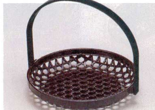
10-550-11 1-618-10 A 7寸竹かご マロン (折畳式) ¥1,000 (21φ×19.5) 楕100