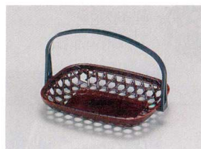
10-550-13 1-618-15 A 5.5寸長手手提かご 溜 (折畳式) ¥750 (16.8×12.2×11) 楕200