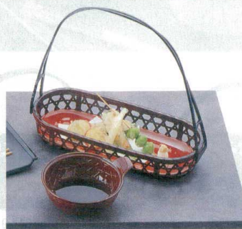
10-551-16 1-620-8 A 8.5寸長手愛染籠溜 本体のみ ¥1,200 (24.8×11×4.4) 梱60