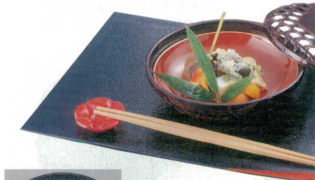
10-551-15 1-620-7 陶 5寸丸皿 青磁流水春秋 (6寸かごめ用) 限定品 ¥1,650 (14.5φ×1.8) 梱60