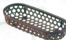
10-551-17 1-620-8A A 8.5寸長手愛染籠溜(折畳式) ¥1,600 (25×10.9×22) 梱60