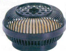
10-551-1 1-621-1 A 銀河かご 黒セット(中皿別売) ¥2,500 (16.7φ×9) 梱80