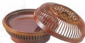
10-551-2 1-9-3 A 銀河かご 漆調春慶底黒塗(中皿別売) ¥2,900 (16.7φ×9) 梱80