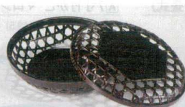
10-551-14 1-620-5 A 6寸かごめ溜 オヤ・フタ ¥1,300 (18φ×6) 梱100