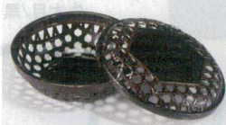
10-551-13 1-620-3 A 4.6寸かごめ溜 オヤ・フタ ¥900 (13.9φ×6) 梱150