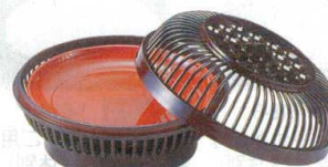
10-551-3 1-621-3 A 銀河かご 溜セット(中皿別売) ¥2,700 (16.7φ×9) 梱80