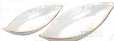
10-557-6 TM (小)しずく鉢 白アクア測金