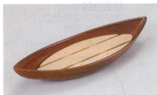
10-557-5 木両舟盛器 目皿(クリアー付)