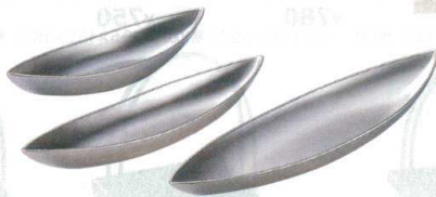
10-557-2 両舟盛器 総銀塗