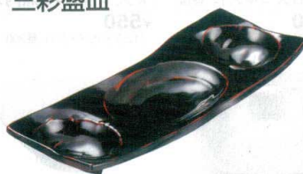
10-557-12 TM 三彩盛皿 曙