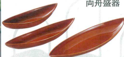
10-557-1 両舟盛器 漆調総巻慶塗