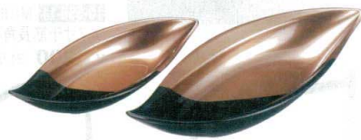
10-557-10 TM (小)しずく鉢 ブラウンメタ/黒裏黒塗