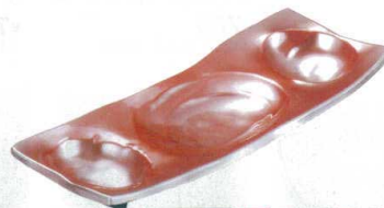
10-557-13 TM 三彩盛皿 赤銀メタ