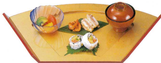
10-566-12 A徳川盛器 色紙金箔天朱 S・H塗 1-694-6 ¥5,000 (56×29.8×4.8) 櫃20