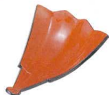
10-566-9 1-677-26 A扇面付出し皿 朱 ¥1,150 (20.8×13.5×4.8) 櫃100