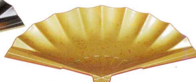
10-566-4 1-700-5 A扇面盛込器 色紙金箔測朱(中) S・H塗 ¥5,900 (52×30.5×4.1) 櫃20