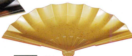
10-566-6 1-700-6 A扇面盛込器 色紙金箔測朱(大) S・H塗 ¥8,500 (61×36×5.5) 櫃10