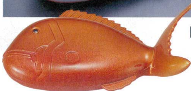
10-566-13 1-701-3 A1人用鯛盛器 ぼかし梨地 中皿付セット ¥6,000 (32×17×10) 櫃40