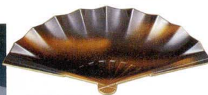
10-566-1 1-700-1 A扇面盛込器 三本雲(小) ¥2,650 (40.7×24×3.5) 櫃60