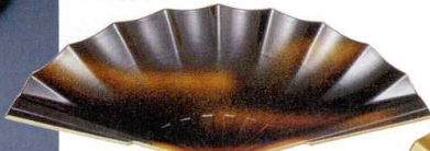
10-566-3 1-700-3 A扇面盛込器 三本雲(中) ¥4,000 (52×30.5×4.1) 櫃20