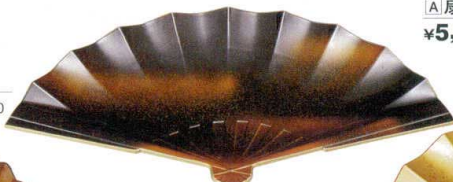
10-566-5 1-700-4 A扇面盛込器 三本雲(大) ¥6,050 (61×36×5.5) 櫃10