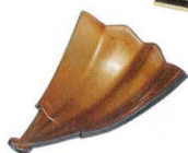
10-566-10 1-677-27 A扇面付出し皿 梨地 ¥1,350 (20.8×13.5×4.8) 櫃100