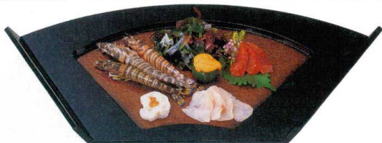
10-566-11 A徳川盛器 アクアブラウン 1-694-5 ¥4,100 (56×29.8×4.8) 櫃20