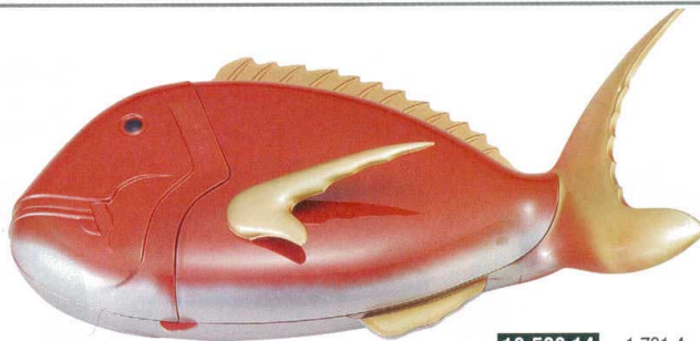
10-566-14 1-701-4 A2尺4寸鯛盛器 金銀パール ¥26,000 (72×37×23) 櫃3