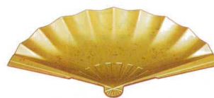
10-566-2 1-700-2 A扇面盛込器 色紙金箔測朱(小) S・H塗 ¥4,300 (40.7×24×3.5) 櫃60