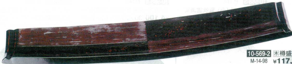
10-569-2 樽盛器 1号 市松春秋 M-14-98 ¥117,500(88×18×6.5)