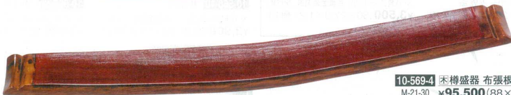
10-569-4 樽盛器 布張根来 M-21-30 ¥95,500(88×12.5×6.8)