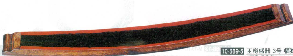
10-569-5 樽盛器 3号 幅狭黒/朱 M-14-96 ¥58,000(88×11×6.5)