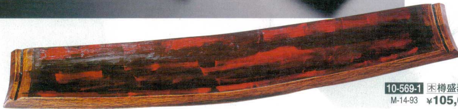
10-569-1 樽盛器 1号 下地風 M-14-93 ¥105,000(88×18×6.5)

ウイスキーの樽を、 1400年余りの歴史を有する 越前漆器の高度な技術を用いて 製作した商品です。