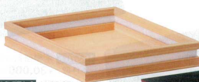
10-571-6 M-25-27 木製安土ひし型盛器 ¥8,000 (32×18.5×4.5) 梱40