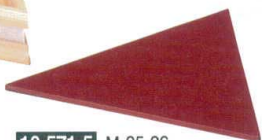
10-571-5 M-25-26 木製安土三角盛器用目皿 朱/黒 ¥2,900 (21×18×0.5) 梱100