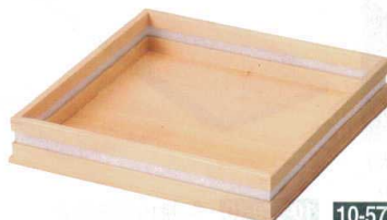
10-571-10 木製安土正角盛器 M-25-21 (小) ¥8,000 (20.5×20.5×4) 梱40 M-25-23 (大) ¥9,100 (23.5×23.5×4) 梱30