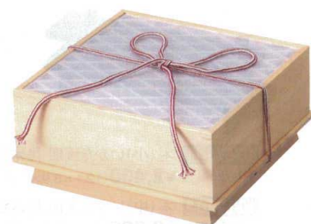
10-571-14 M-25-42 木製桃山玉手箱 ¥18,500 (24.5×24.5×12) 梱15 (本体 内寸21×21×1.7)