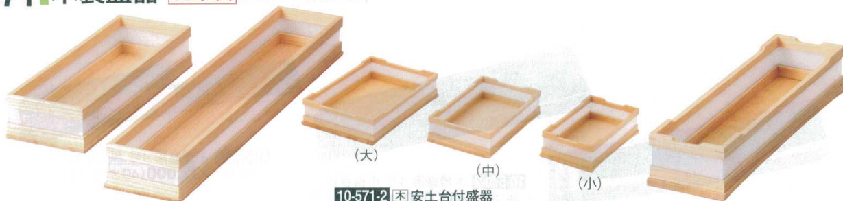
10-571-1 木製安土長角盛器 M-25-29 (小) ¥7,000 (26.5×9.7×5.3) 梱50 M-25-30 (大) ¥9,200 (47×9×5.3) 梱25