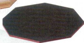
10-571-9 M-25-20 木製安土八角盛器用目皿 朱/黒 ¥3,500 (20.5×20.5×0.5) 梱100