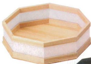
10-571-8 M-25-19 木製安土八角盛器 ¥9,400 (22×22×6) 梱30