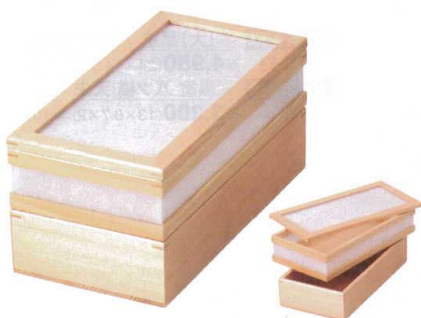
10-571-12 木製安土長角二段弁当(小) M-25-45 蓋 ¥2,200 (25.3×13×1.2) 梱80 M-25-46 中段 ¥6,300 (25.2×13×5.4) 梱40 M-25-47 下段 ¥5,800 (25.1×13×5.6) 梱40 下段仕切無