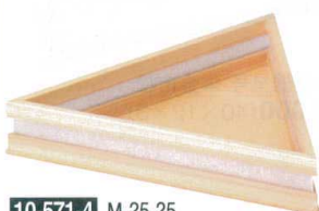
10-571-4 M-25-25 木製安土三角盛器 ¥7,800 (24×21×4.5) 梱40