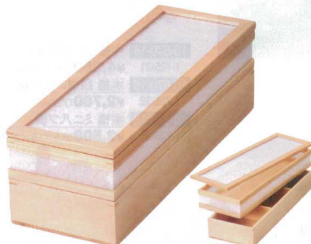
10-571-13 木製安土長角二段弁当(大) M-25-48 蓋 ¥3,700 (37.2×13×1.2) 梱60 M-25-49 中段 ¥8,400 (37.3×13×5.3) 梱30 M-25-50 下段 ¥6,900 (37.3×13×5.6) 梱30 (下段固定仕切 穴内寸11.5×11.5×5)